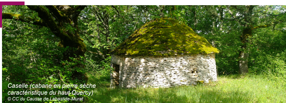
Caselle (cabane en pierre sèche caractéristique du haut-Quercy)

L'articulation des Plans de paysage et plus généralement des démarches paysagères avec la planification par un PLUi contribue à l'atteinte des ODD fixés par l'ONU à l'horizon 2030, essentiellement via l'ODD 11 « Villes et communautés durables » et l'ODD15 « Protection de la faune et de la flore terrestres ».