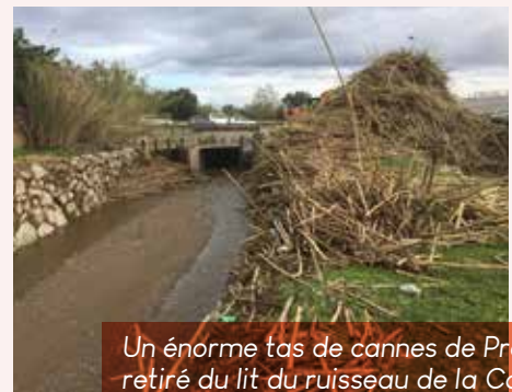
Un énorme tas de cannes de Provence retiré du lit du ruisseau de la Corbaia au niveau de la RT11.

La Réouverture de ces différentes infrastructures s'est échelonnée du 7 décembre 2016 au 14 avril 2017 .