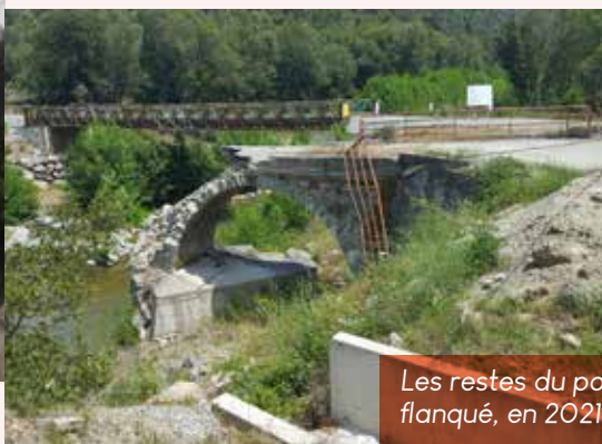
Les restes du pont de la Casaluna flanqué, en 2021, d'un pont provisoire

Une grande partie de la Haute-Corse a ainsi subi de très nombreux dégâts dans le Cap, la Castagniccia, la région de St-Florent et la plaine de Bastia à Borgo. Ce sont surtout les voiries qui ont été endommagées et de nombreux villages se sont retrouvés isolés. 4 ponts ont été détruits dont celui qui franchissait la Casaluna sur la commune de Gavignano dans le Boziu. Sa destruction a entraîné l'enclavement complet du secteur.