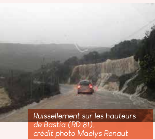
Ruissellement sur les hauteurs de Bastia (RD 81)