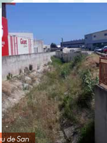
Le ruisseau de San Pancrazio à Furiani

Enfin, la Mormorana sépare Borgo de la commune de Lucciana où se trouve, peu après, l'embouchure en mer du Golo, plus grand fleuve de Corse.