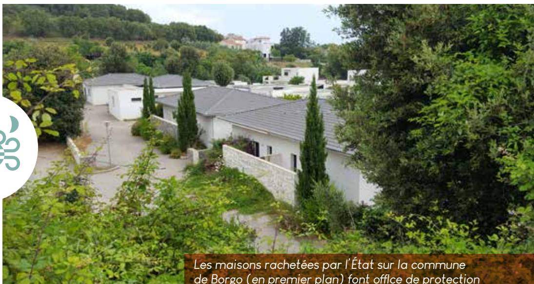
Les maisons rachetées par l'État sur la commune de Borgo (en premier plan) font office de protection temporaire pour celles situées juste en aval (en arrière-plan).