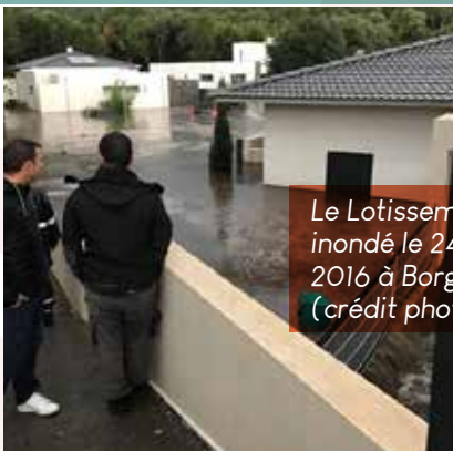
Le Lotissement "Umbrione I" inondé le 24 novembre 2016 à Borgo...

Les voiries et les activités économiques n'ont pas été les seuls enjeux impactés. Certaines habitations ont également été fortement endommagées . C'est le cas à Borgo , où le lotissement "l'Umbrione", situé dans une dépression en rive droite du Pietre-Turchine , a été inondé sous 1m 50 d'eau par endroits . C'est dans cinq maisons de plain pieds que la situation a été le plus critique. Leurs habitants, heureusement ont pu se mettre hors d'eau sur des hauteurs avoisinantes.