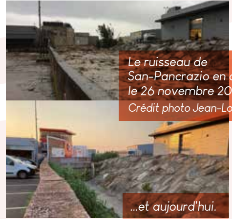
Le ruisseau de San-Pancrazio en crue le 26 novembre 2016 ...