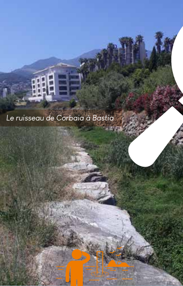
Le ruisseau de Corbaia à Bastia