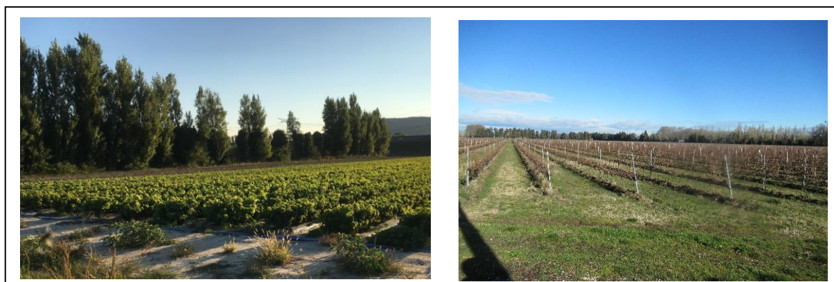
Figure 2 : A gauche, haie de peupliers offrant un masque efficace, à droite : parcelles de vigne à proximité immédiate à l'est

On constate une forte visibilité aux abords immédiats à l'est du projet, cependant les enjeux y sont faibles puisqu'il s'agit de parcelles de vigne sans habitation. La végétation le long de la route à l'est de ces vignes masque très efficacement le projet et la visibilité est très nettement réduite au-delà de celles-ci. Les haies de peupliers et de cyprès, séparant les petites parcelles agricoles à l'est du site, permettent de supprimer très rapidement la visibilité ; dès 500 à 700 mètres, plus aucun point de la centrale n'est visible.