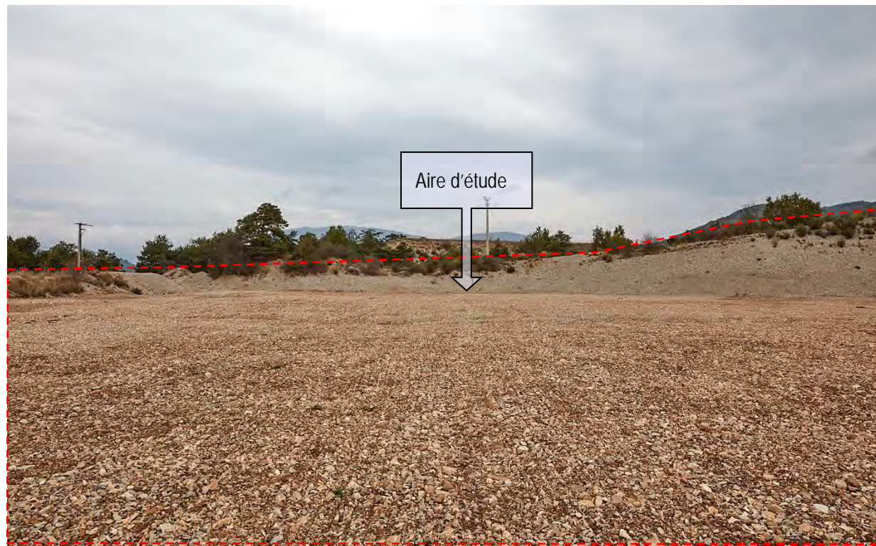
VUE ECHELLE RAPPROCHEE/IMMEDIATE N° 12 : AU MILIEU DE L'ESPLANADE, VUE NORD