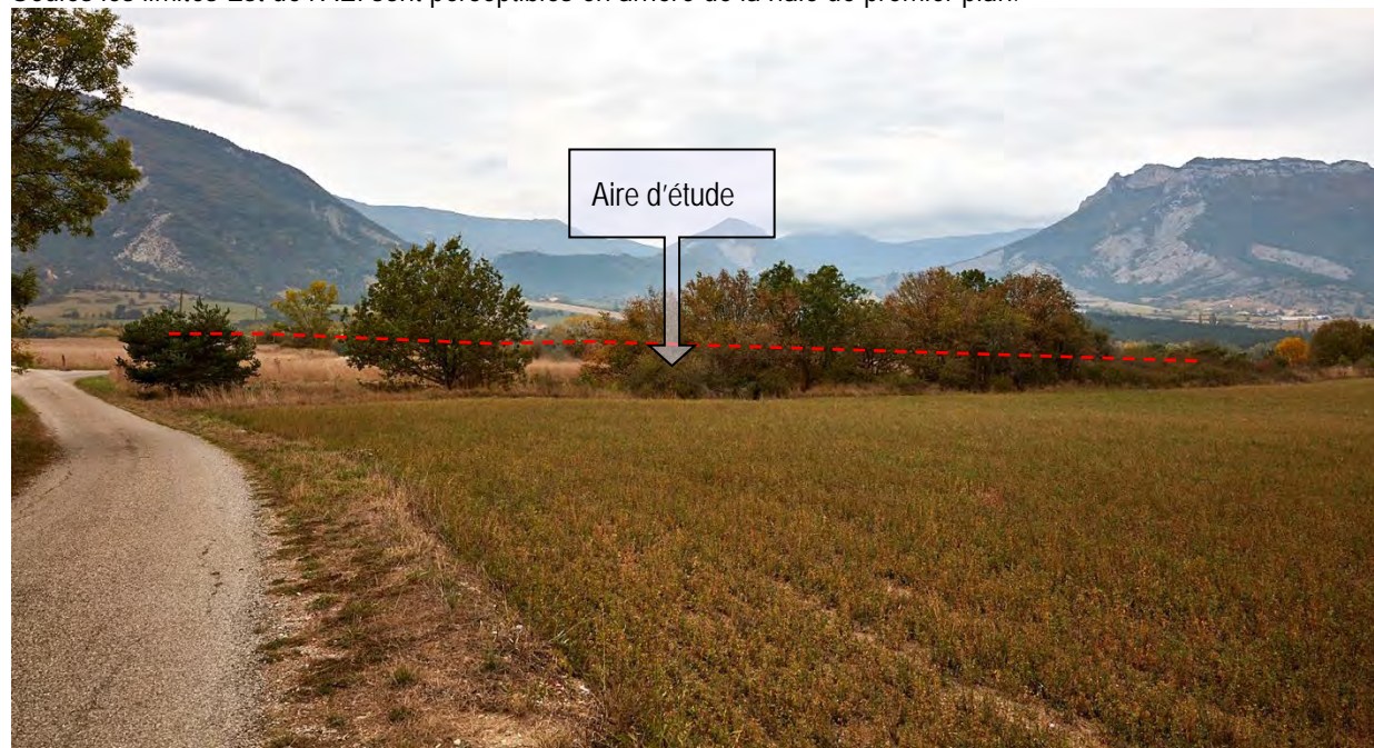
VUE ECHELLE RAPPROCHEE/IMMEDIATE N° 6 : SUR LA ROUTE QUI DESSERT LE LIEUDIT « LA PINCE ». Seules les limites Est de l'AEI sont perceptibles en arrière de la haie de premier plan.