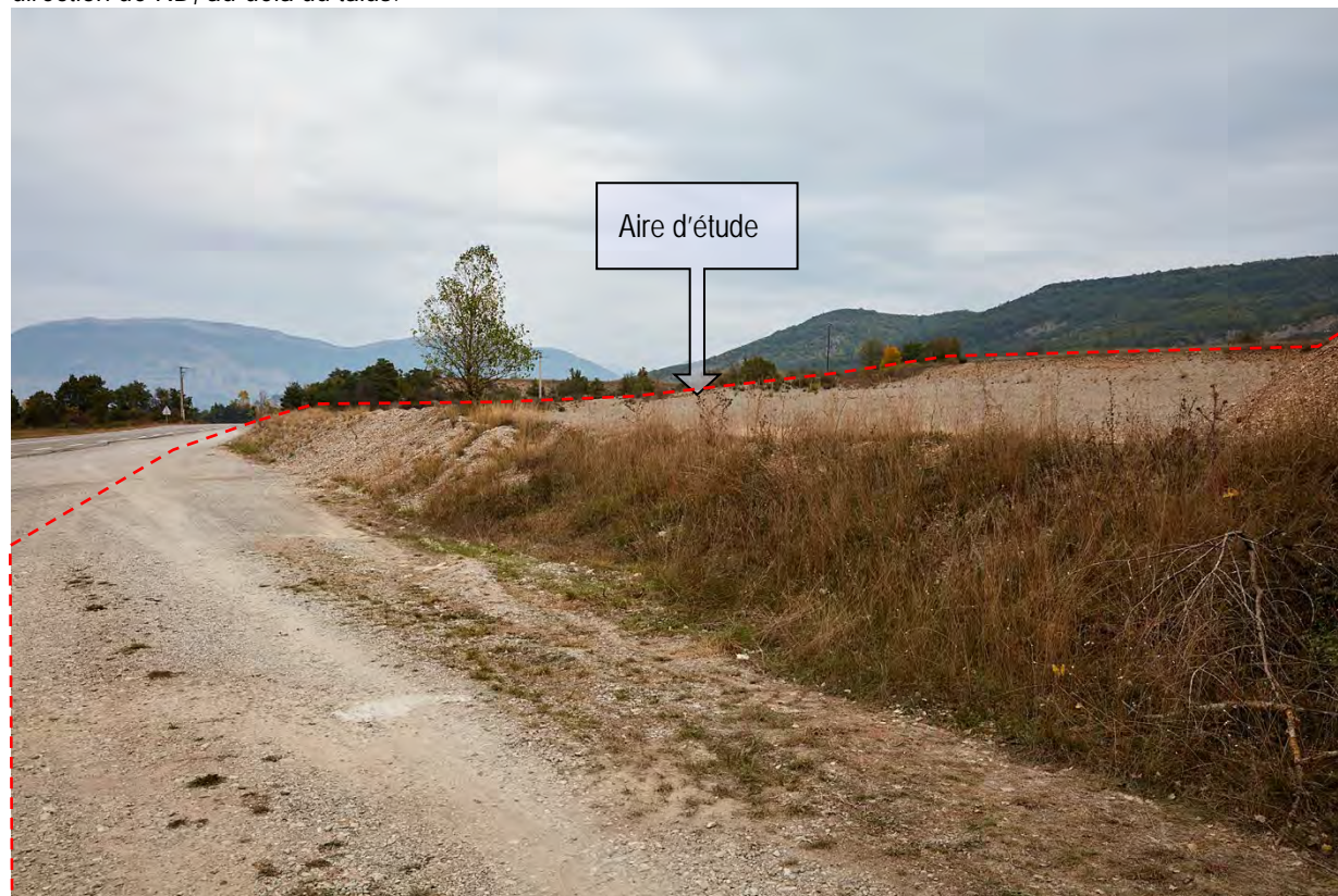
VUE ECHELLE RAPPROCHEE/IMMEDIATE N° 9 : EN BORDURE DE DEPARTEMENTALE Les talus qui bordent la départementale dessinent le premier plan, même si les limites de l'AEI se prolongent en direction de RD, au-delà du talus.