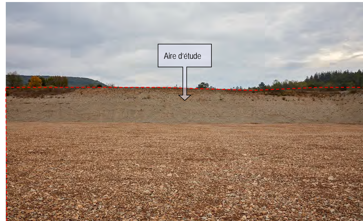
VUE ECHELLE RAPPROCHEE/IMMEDIATE N° 14 : AU MILIEU DE L'ESPLANADE, VUE EST