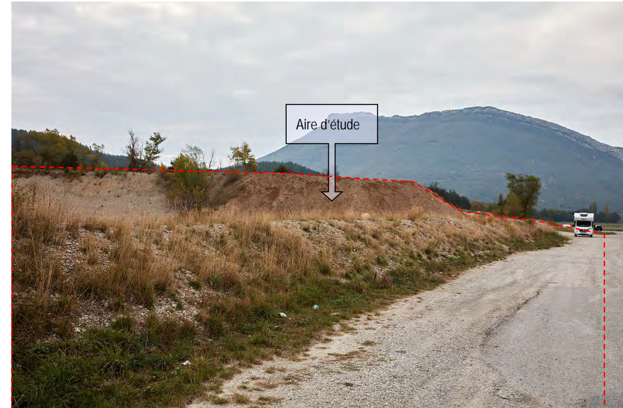
VUE ECHELLE RAPPROCHEE/IMMEDIATE N° 10 : EN BORDURE DE DEPARTEMENTALE Le talus Ouest, composé de graviers mélangés à du substrat plus terreux a permis à quelques végétaux de prendre racine.