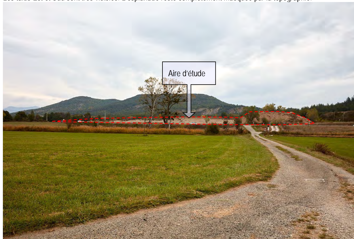
VUE ECHELLE RAPPROCHEE/IMMEDIATE N° 8 : DEPUIS LE LIEUDIT « SAINT-LOUIS » Les talus Est et Sud sont très visibles. L'esplanade reste complètement masquée par la topographie.