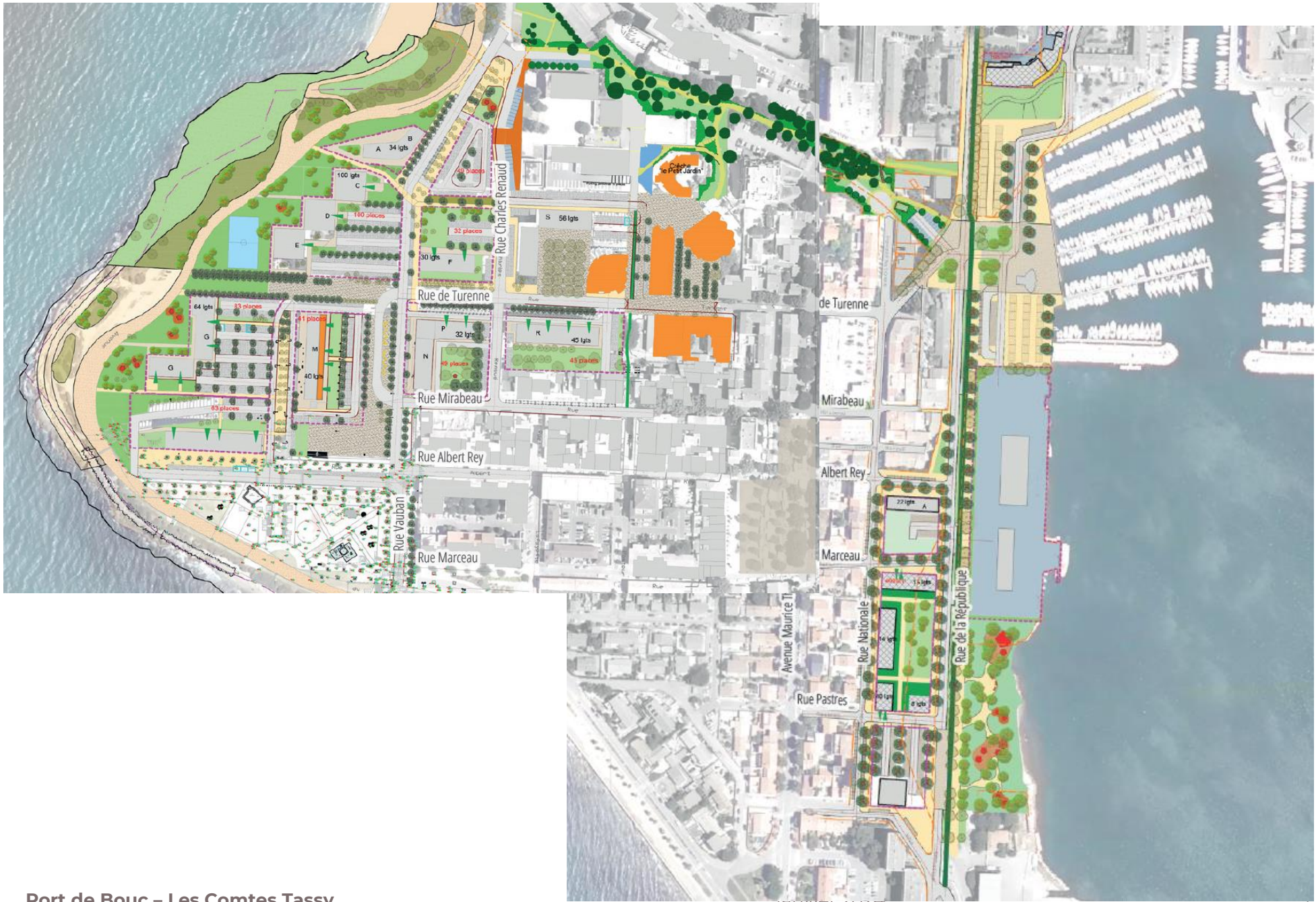
Port de Bouc – Les Comtes Tassy