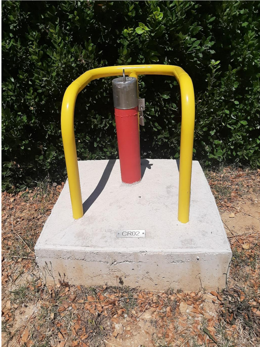
Figure 2 : Extension de l'ouvrage une fois terminé