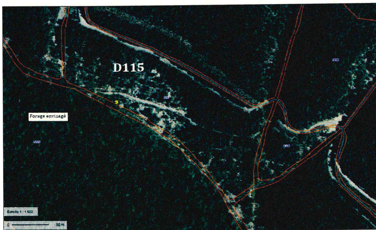
Figure 2 : Forage envisagé sur photo aérienne et fond cadastral