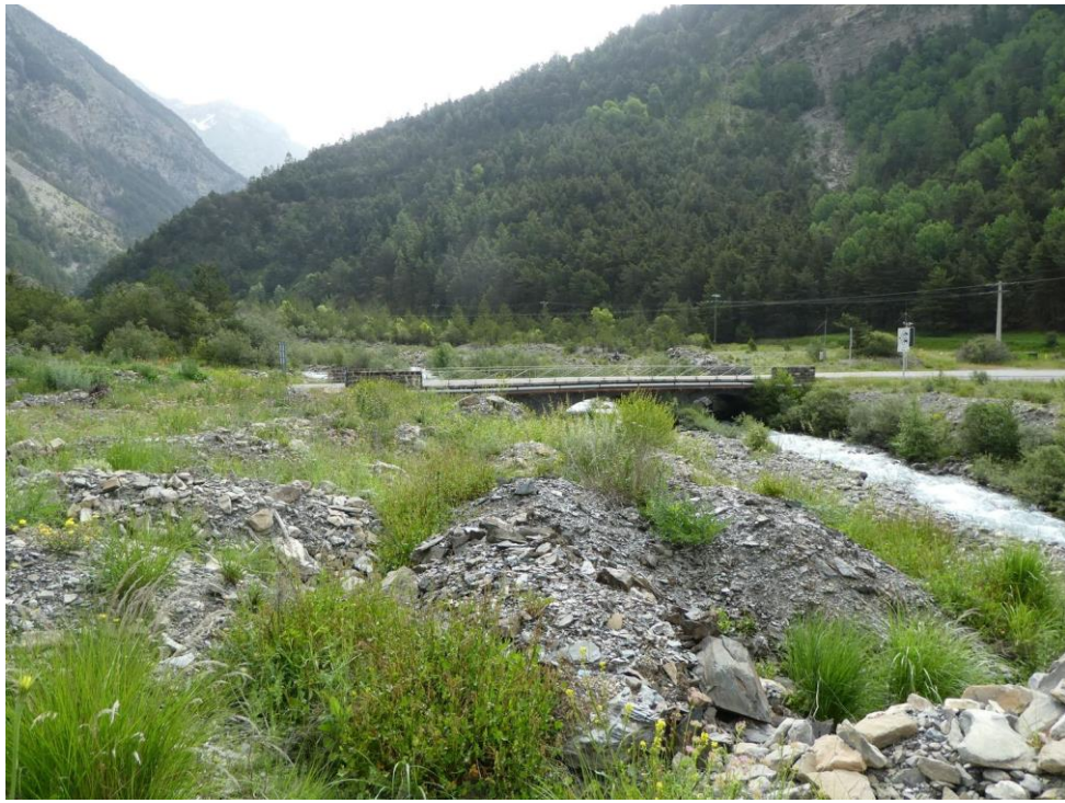
Photo 7 - Berge droite aval et berge gauche vues depuis la rive droite (2023)