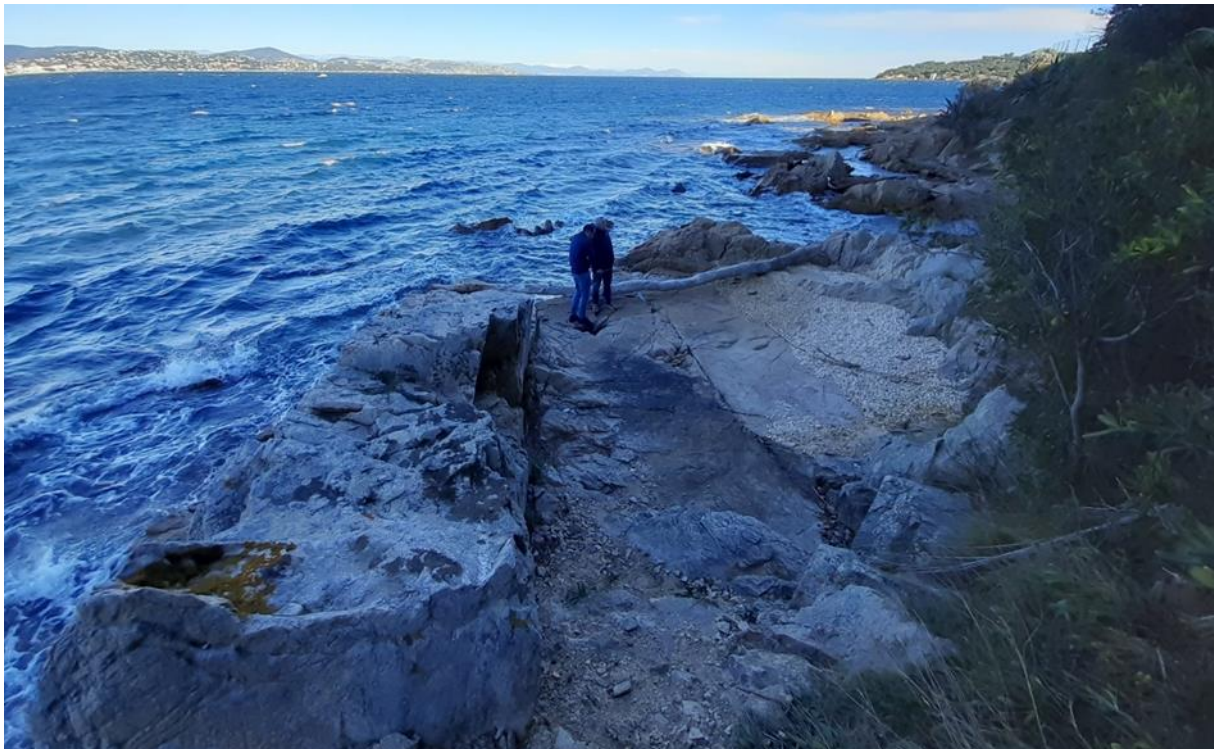
Figure 2 Vue drone de 2022 zone du projet