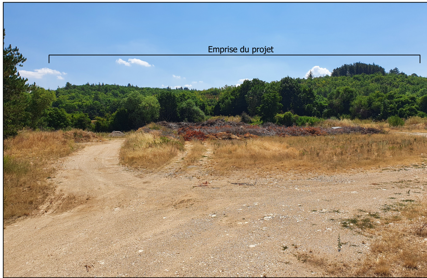
PDV1- Localisation du projet dans son environnement proche - Juillet 2022