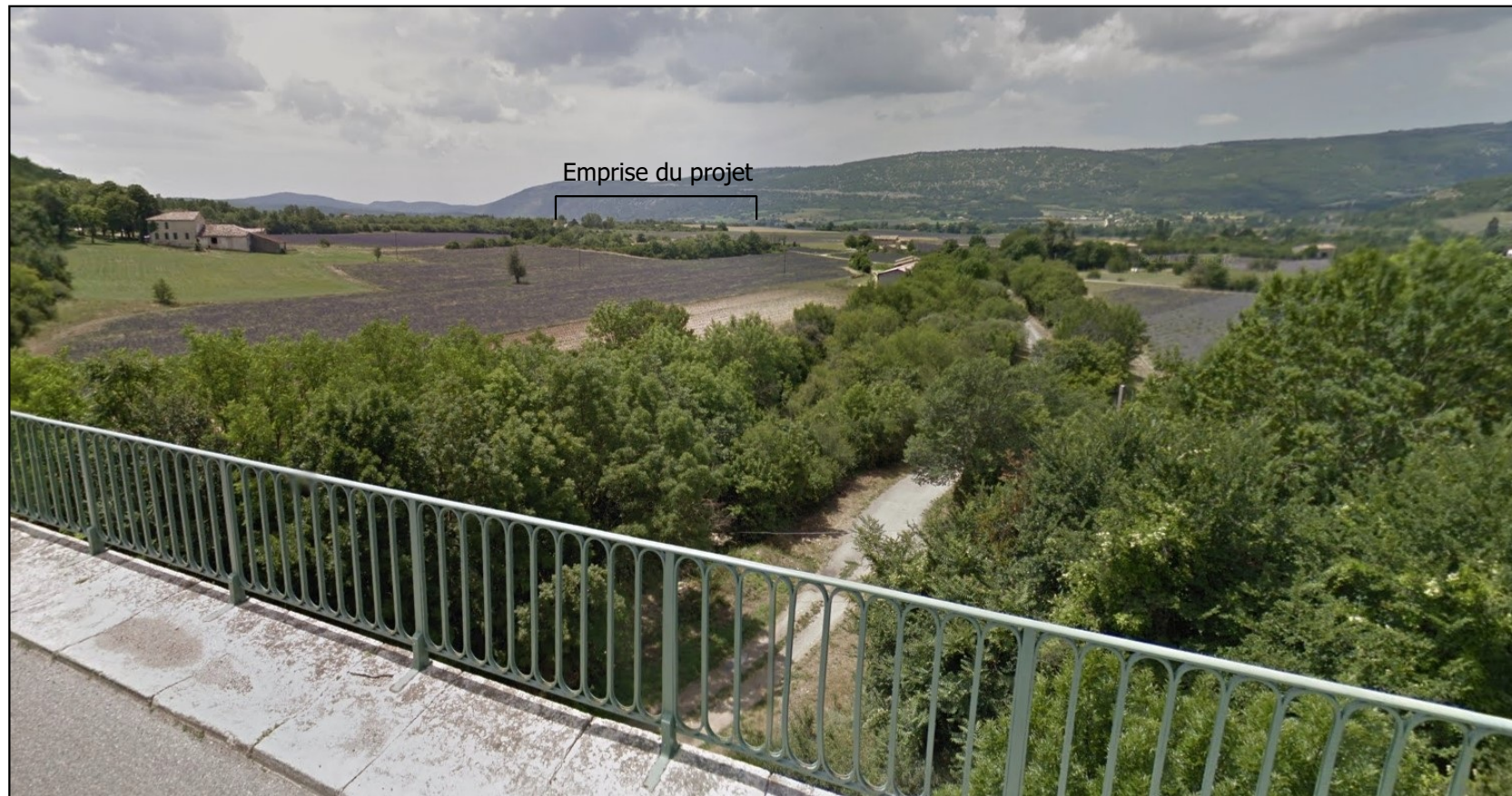
PDV2- Localisation du projet dans le paysage lointain - Juillet 2013