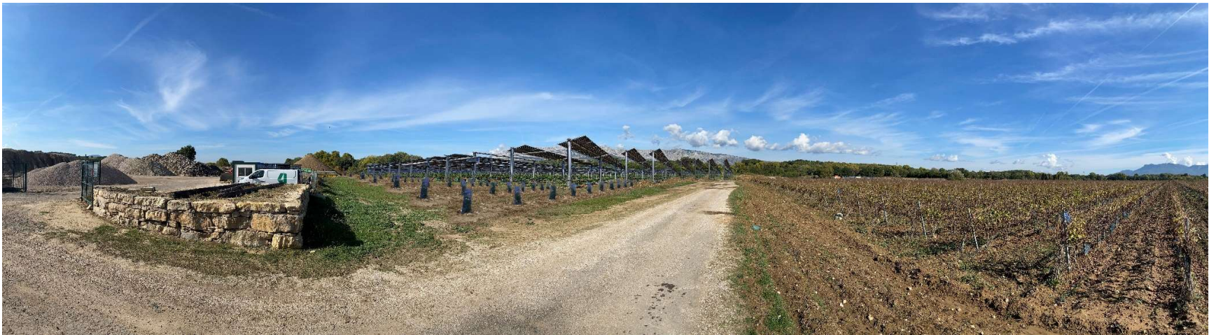
Après insertion paysagère