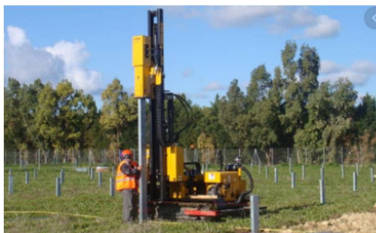
Figure 3. Ancrage des pieux battus