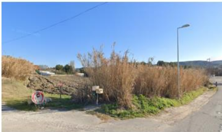
Point de vue n°5