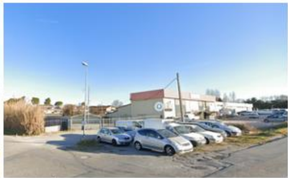
Point de vue n°1 (à gauche) et n°2 (à droite)