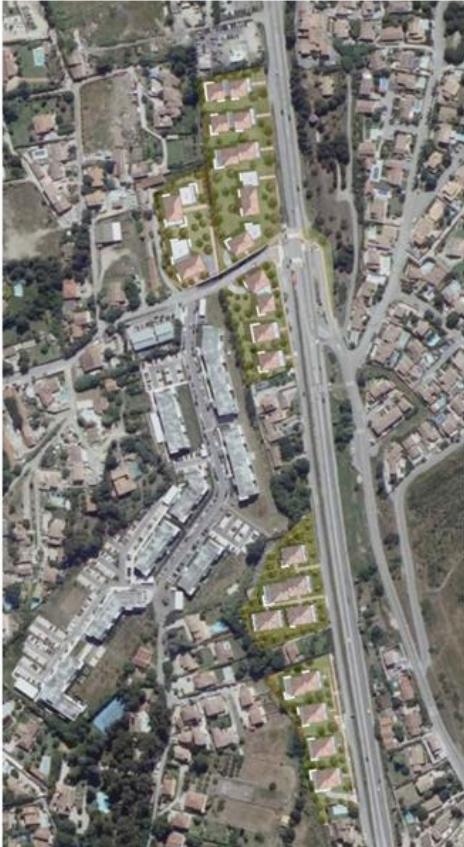
Plan prévisionnel du projet