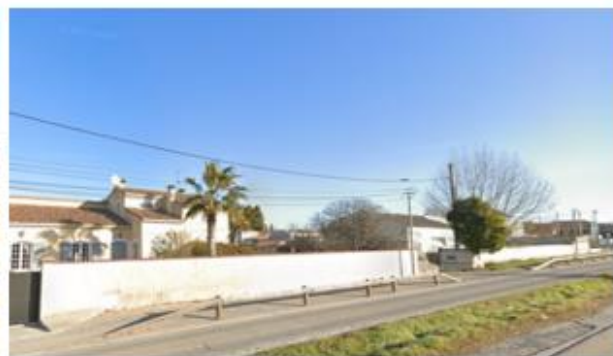
Point de vue n°3 (à gauche) et n°4 (à droite)