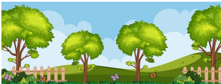
Croquis – Respect des strates de végétation arborée, arbustive et herbacée

L'application de ces préconisations lors des opérations de débroussaillage permettra la conservation de la biodiversité sur la parcelle.