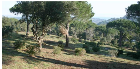
Exemple de rendu du débroussaillage extensif

Préconisation : Ne pas faire de coupe rase et conserver quelques touffes à herbes hautes et bouquets de fleurs au sein des pelouses ce qui permet aux insectes de venir.