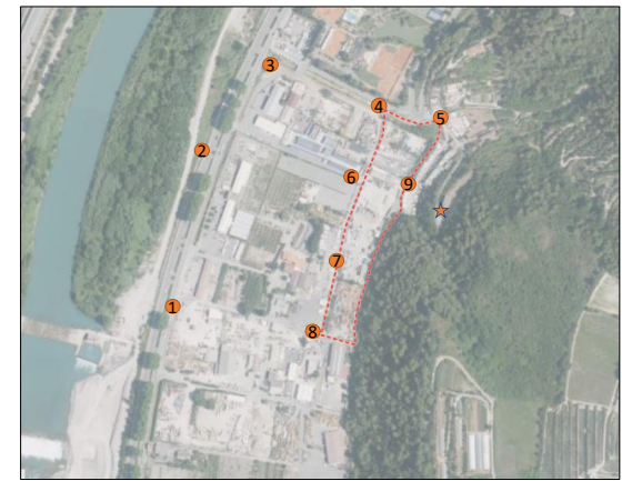
Photos de l'intersection de la rue longeant la zone du projet côté Ouest ( direction Est et Nord )