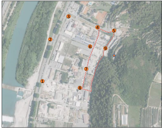
Photos prises vers l'intérieur et l'extérieur de la zone d'activité secteur Nord-Est ( direction Sud et Nord )