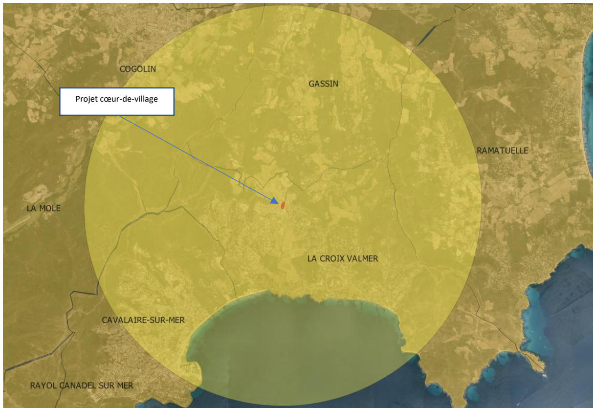
Figure 1 : localisation du projet et de l'aire d'étude