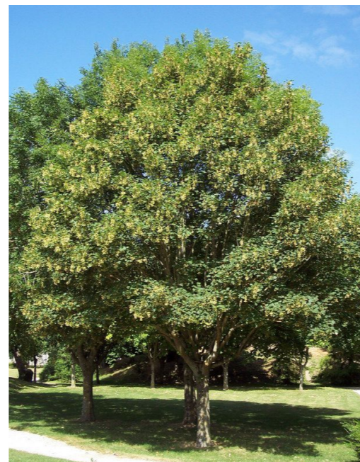
● Acer platanoides (érable plane) - Force : 20-25 Quantité : 8 u.