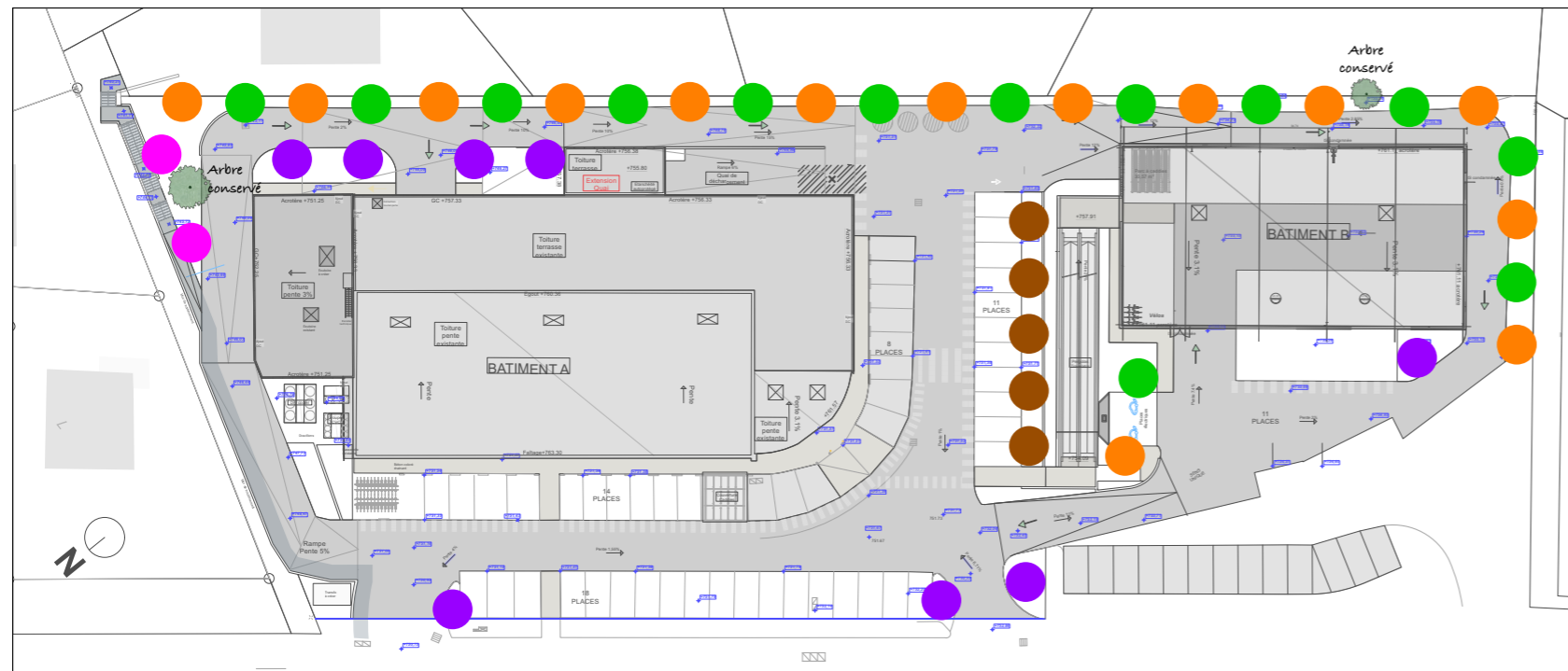
Plan de repérage des arbres tiges.