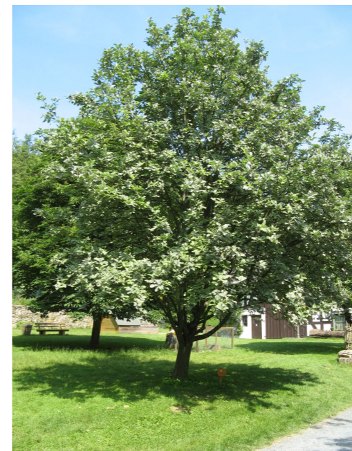
● Sorbus aria (alisier blanc) - Force : 20-25 Quantité : 14 u.