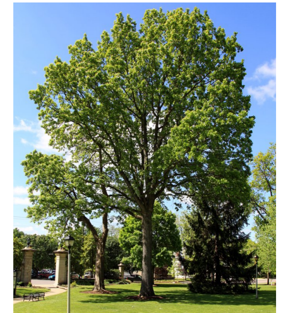
● Quercus pubescens (chêne pubescent) - Force : 14-16 Quantité : 5 u.