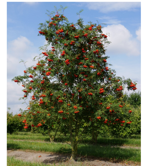
● Sorbus aucuparia (sorbier des oiseleurs) - Force : 20-25 Quantité : 13 u.