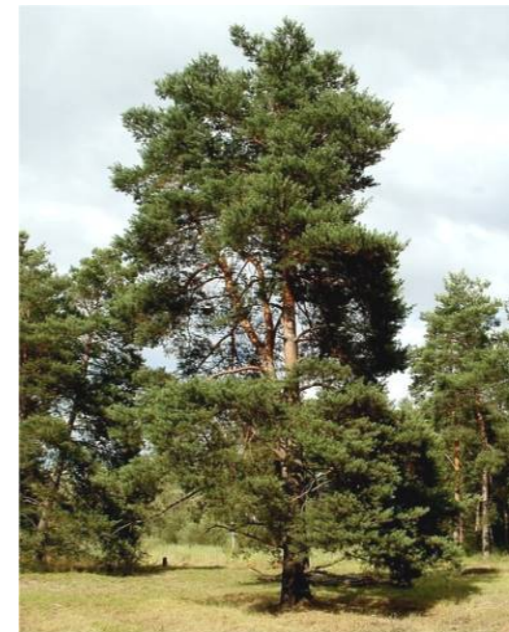
● Pinus sylvestris (pin sylvestre) - Taille : 400/450 Quantité : 2 u.