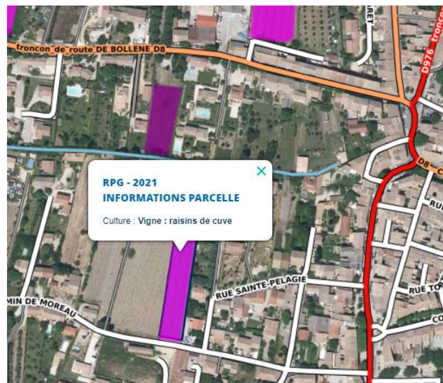
Cartographie des terrains agricoles au sens du RPG 2020 (données géoportail)