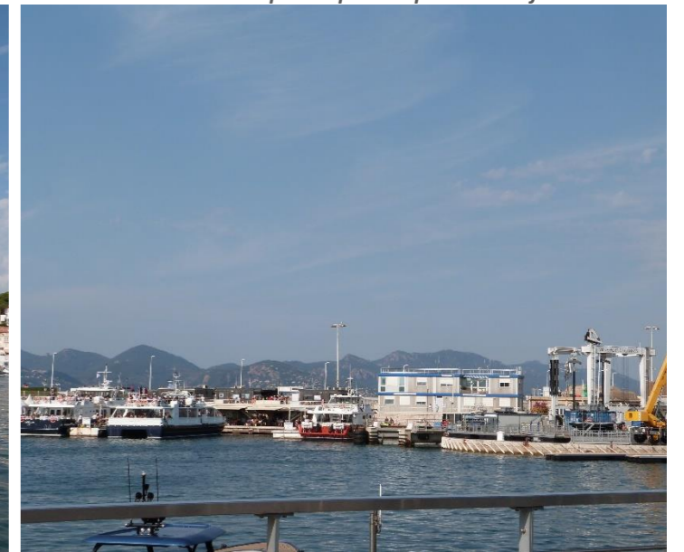
Vue sur le port et l'Estérel depuis la jetée Albert Edouard