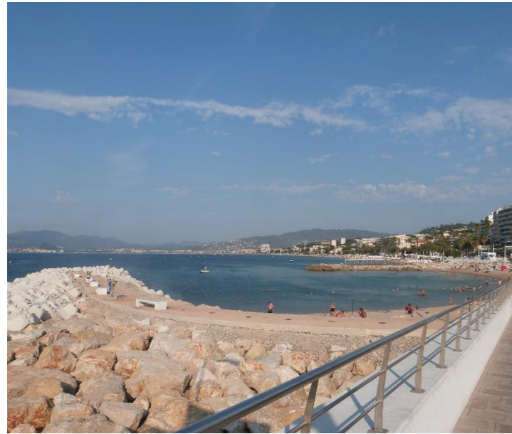
Vue sur les plages du Midi depuis la jetée Joséphine Baker