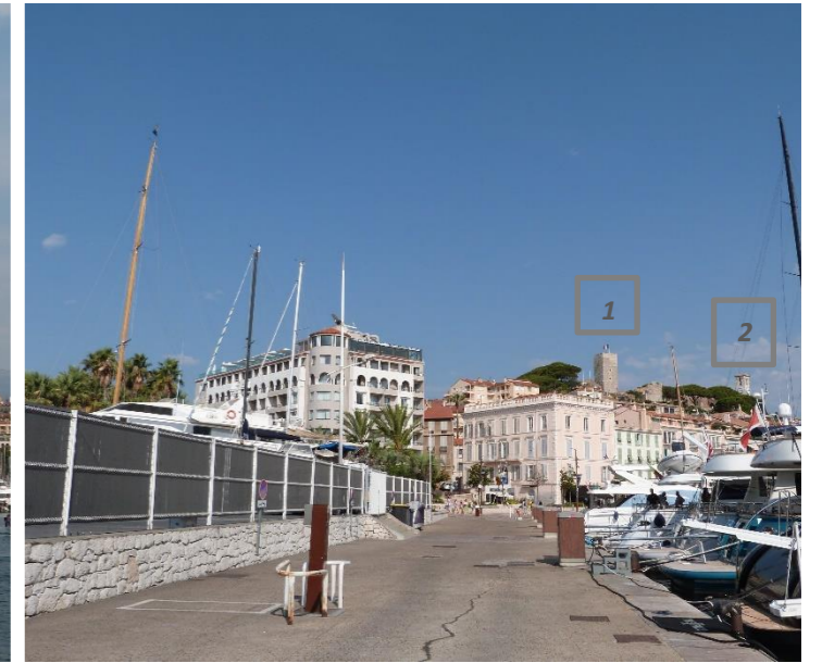
Vue sur le Suquet depuis le quai Laubeuf