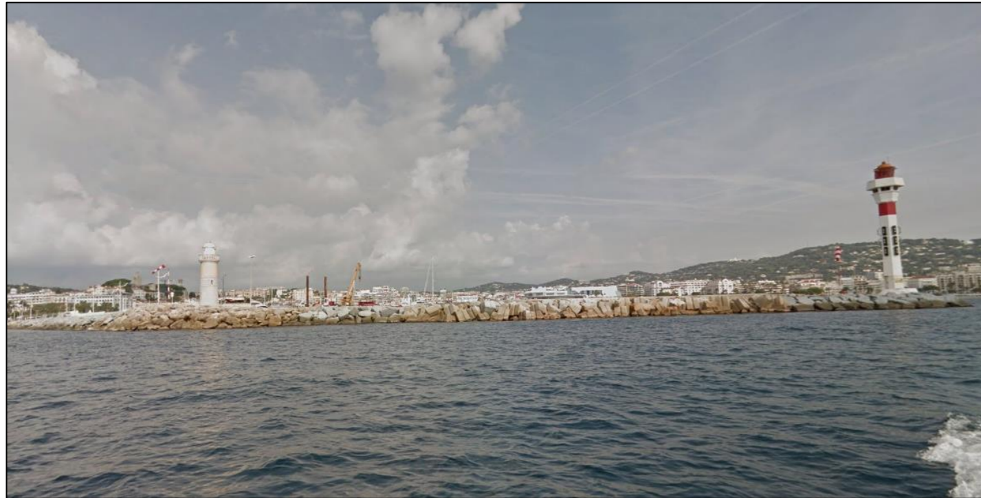
Vue sur le port depuis la mer

Les vues depuis la mer sont dynamiques et changeantes et dépendent de la direction du navire à l'approche du port. La jetée Joséphine Baker, nouvellement construite, vient masquer, en fonction de l'orientation des prises de vue, le front bâti de la vieille ville de Cannes. La jetée est très homogène. La perception de la hauteur de la jetée est difficile depuis la mer. Les deux phares marquent toutefois le paysage par leur verticalité.