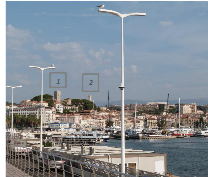
Vue sur le Suquet depuis la jetée Joséphine Baker