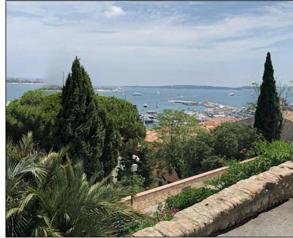
Vue sur le port depuis le Suquet (parvis du château)

Le Suquet offre une vue panoramique sur la baie et sur les îles de Lérins. Le site de projet est visible en enfilade ainsi qu'une partie du parking Laubeuf, plus ou moins caché par la végétation, selon les angles de vue et l'altitude.