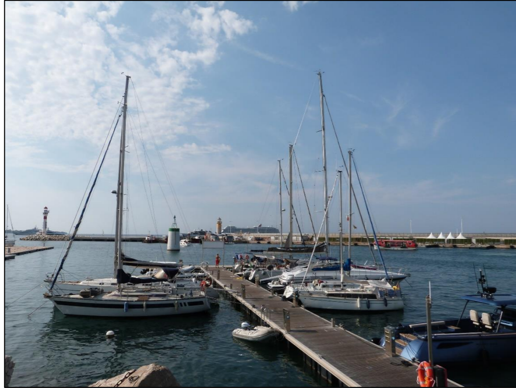
Vue sur le port depuis la jetée Albert Edouard

La jetée Joséphine Baker actuelle ferme l'horizon, rythmé par la présence des deux phares à la verticale. En premier plan est visible le pont d'accueil de la jetée Albert Edouard.