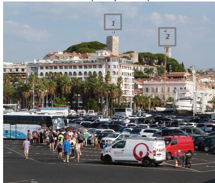
Vue sur le Suquet depuis le parking Laubeuf