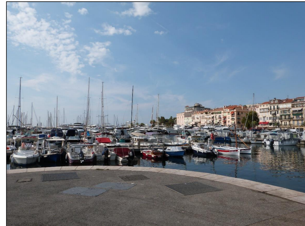
Vue sur le port depuis l'esplanade Pantiero

Les vues depuis l'esplanade Pantiero sont totalement masquées par la volumétrie et les mâts des bateaux du port situé en premier plan.