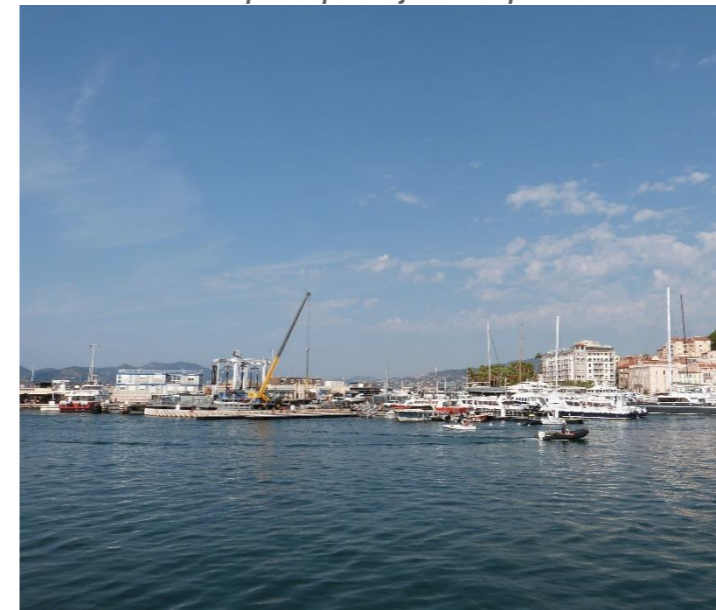
Vue sur le port depuis la jetée Albert Edouard