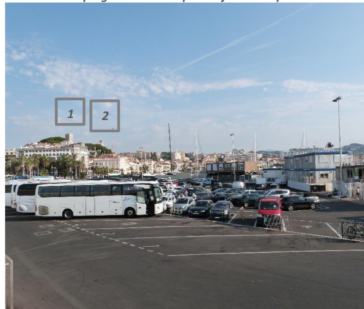
Vue sur le Suquet depuis le parking Laubeuf