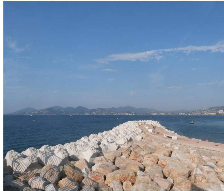
Vue sur l'Estérel depuis la jetée Joséphine Baker