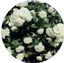
Rosa white meidland