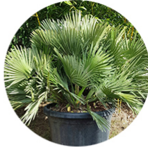
Chamerops humilis Vulcano