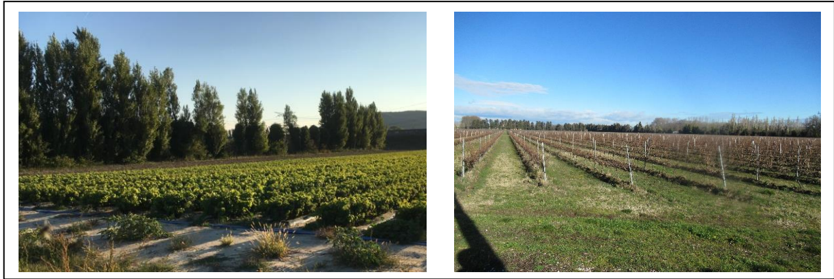
Figure 3 : A gauche, haie de peupliers offrant un masque efficace, à droite : parcelles de vigne à proximité immédiate à l'est

et la visibilité est très nettement réduite au-delà de celles-ci. Les haies de peupliers et de cyprès, séparant les petites parcelles agricoles à l'est du site, permettent de supprimer très rapidement la visibilité ; dès 500 à 700 mètres, plus aucun point de la centrale n'est visible.