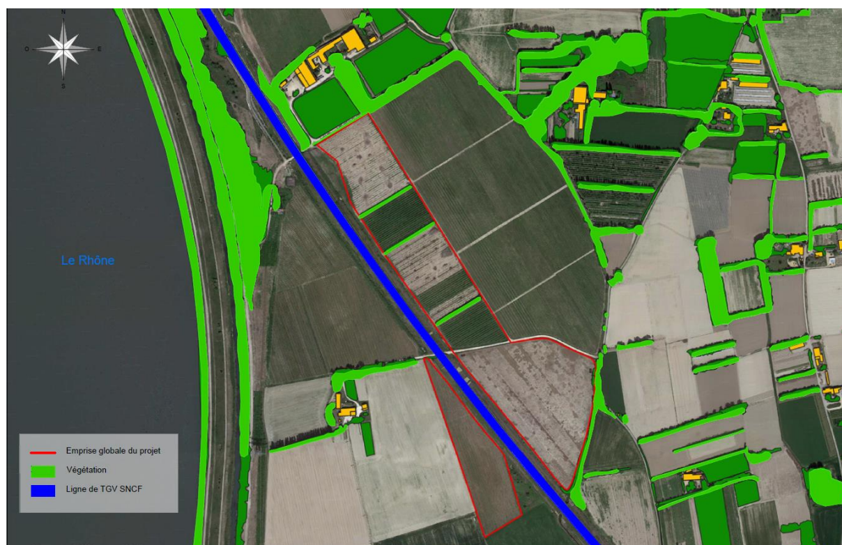
Figure 1 : Cartographie des éléments de paysage masquant naturellement le projet

Les alentours du site d'implantation du projet offrent des éléments de masque permettant d'isoler les structures photovoltaïques de leur environnement. On pourra principalement noter à l'ouest la ripisylve du Rhône, au centre la ligne à grande vitesse de la SNCF surélevée traversant le projet, et à l'est de nombreuses formations végétales. Ces formations sont pour la plupart des haies coupe-vent de grands arbres (notamment des cyprès et des peupliers), qui forment des masques très efficaces pour limiter très nettement la visibilité du projet depuis les environs.