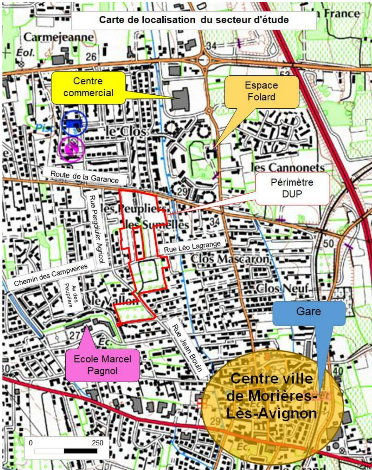
Extrait de la carte IGN