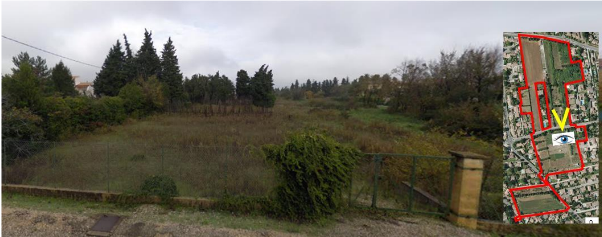
3/ Vue sur des jardins au centre du secteur d'étude