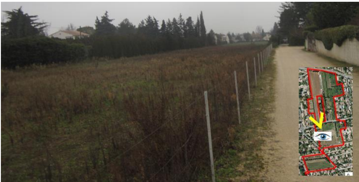
4/ Vue sur une prairie en friche au centre du secteur d'étude