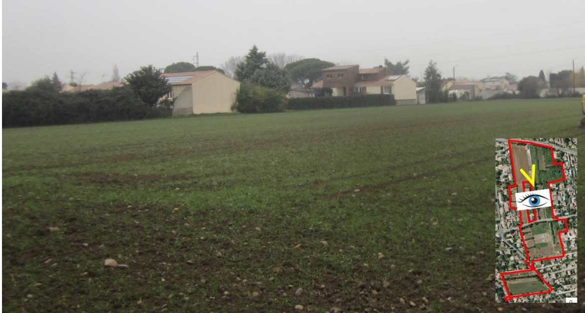
1/ Vue sur la parcelle cultivée au Nord du secteur d'étude

Dans la mesure où le terrain est enclavé, il n'est pas possible de réaliser des vues de loin ; de ce fait, il a été intégré des vues de près, avec plusieurs photos réparties sur l'ensemble du secteur d'étude.