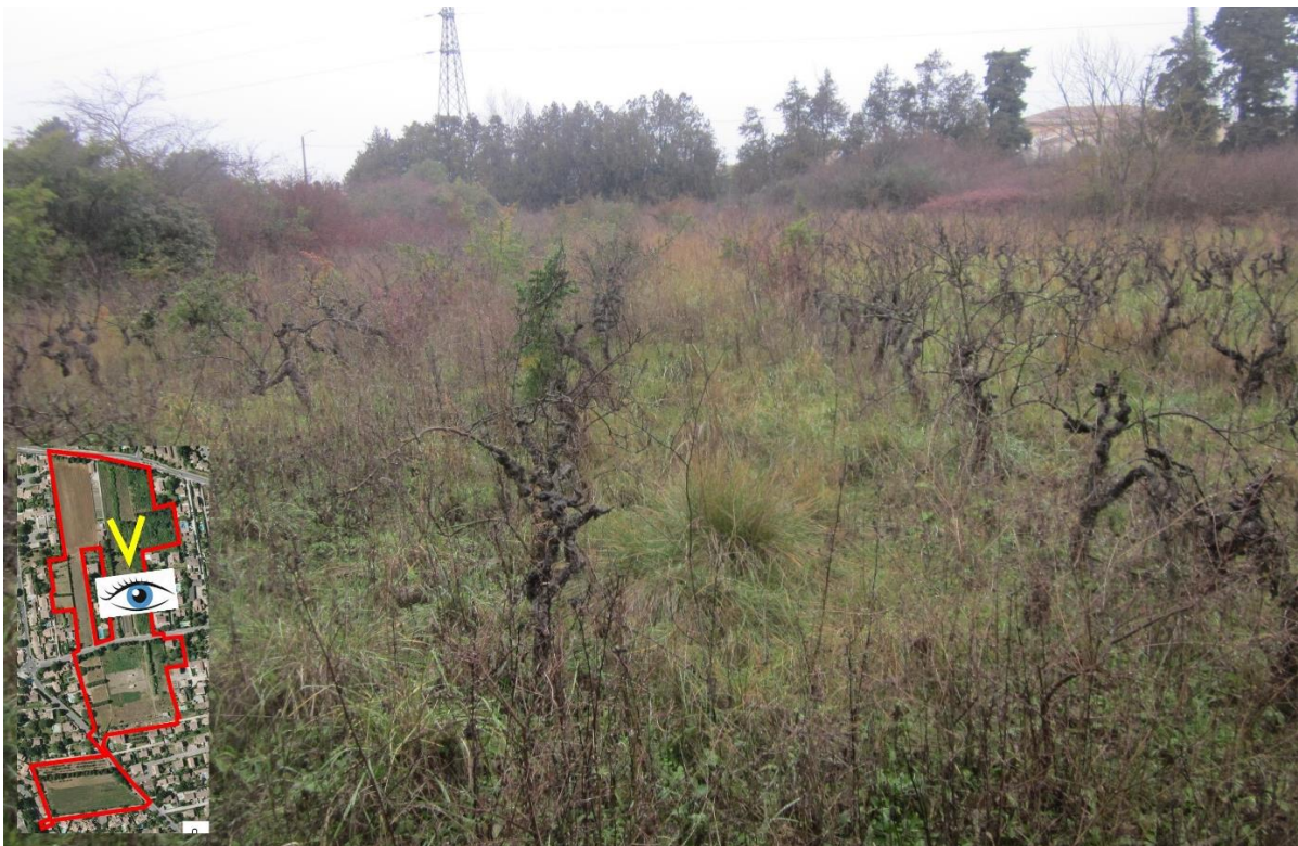
2/ Vue sur la parcelle de vignes abandonnées au Nord du secteur d'étude