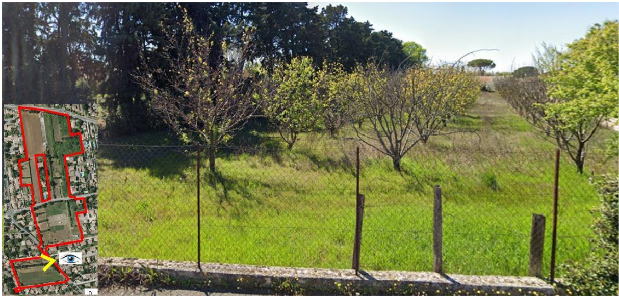
6/ Vue sur un verger au Sud du secteur d'étude