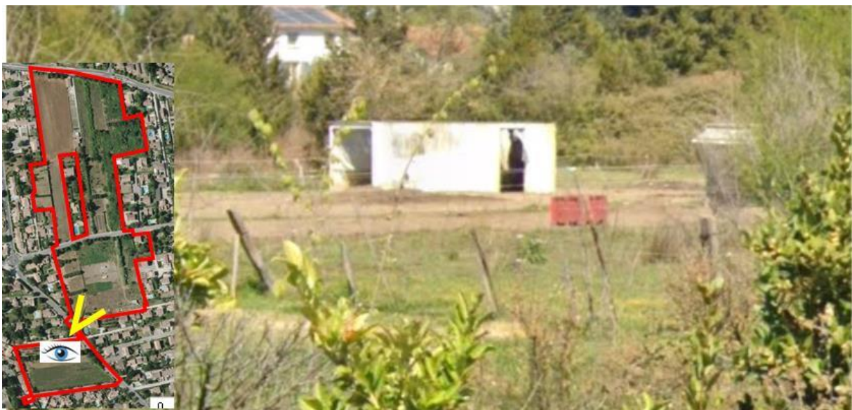
5/ Vue sur l'enclos à chevaux au centre du secteur d'étude