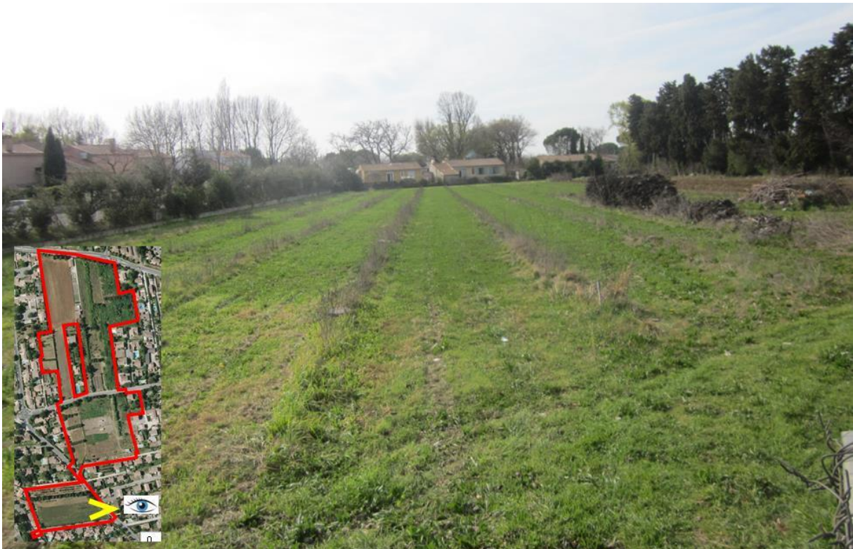
7/ Vue sur un ancien verger en friche au Sud du secteur d'étude