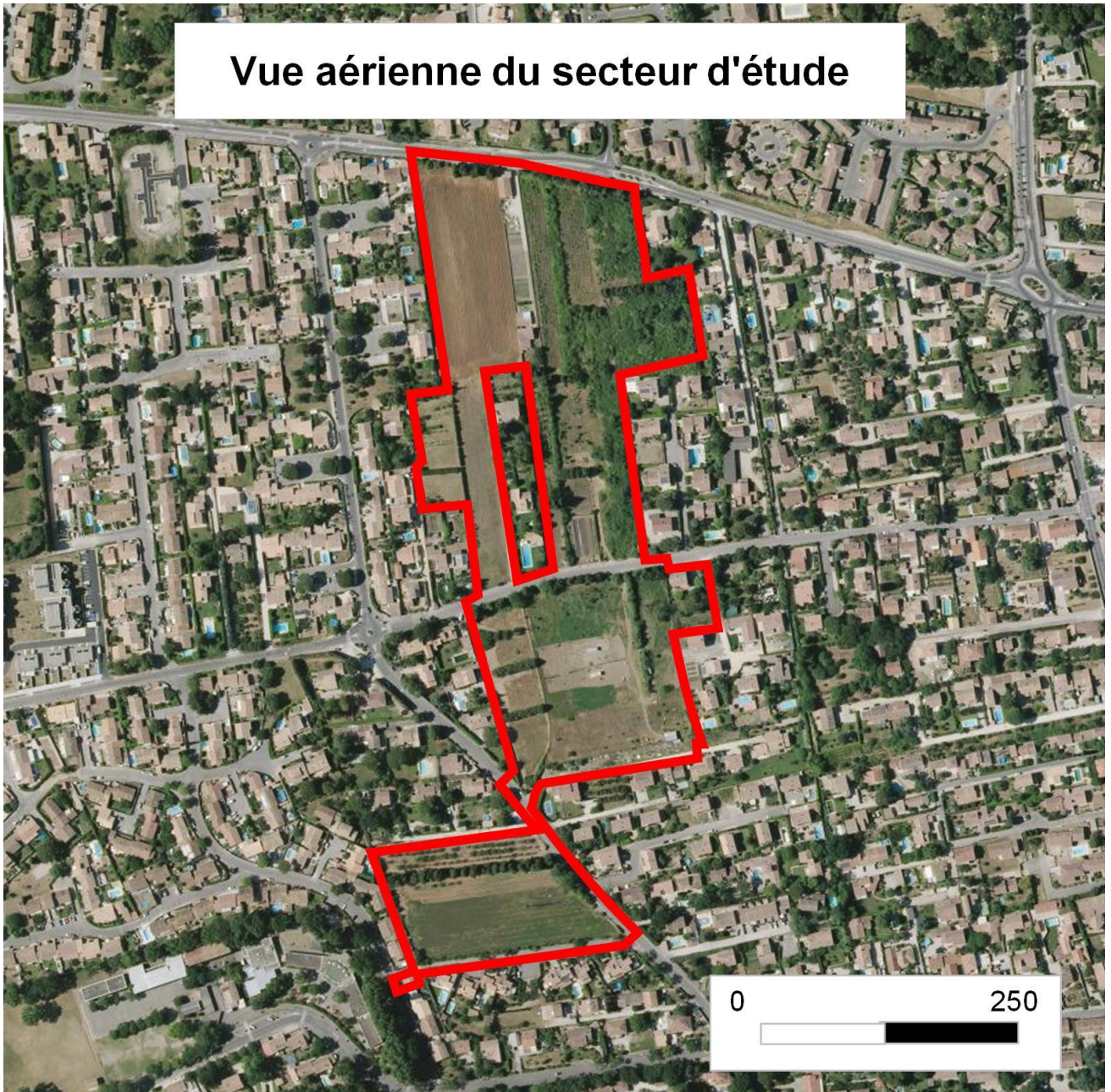
Vue aérienne du secteur d'étude