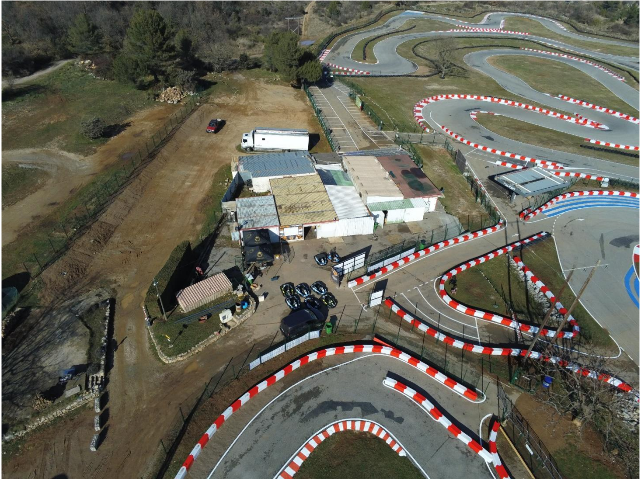
Vue aérienne de l'emplacement du bâtiment à construire à la place des structures légères