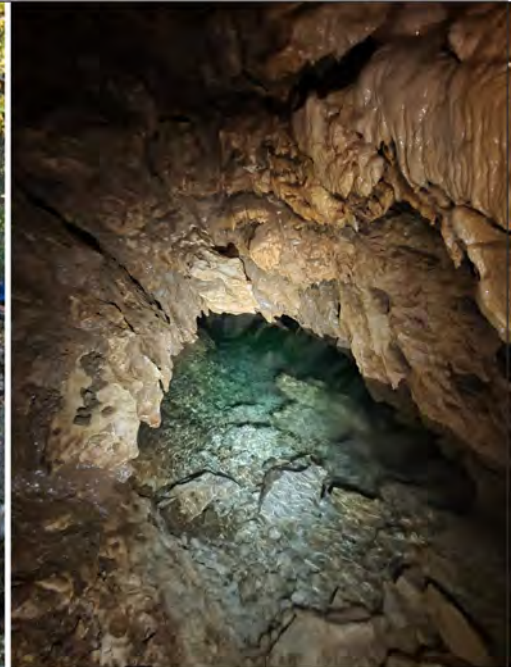
Siphon vers -25 m