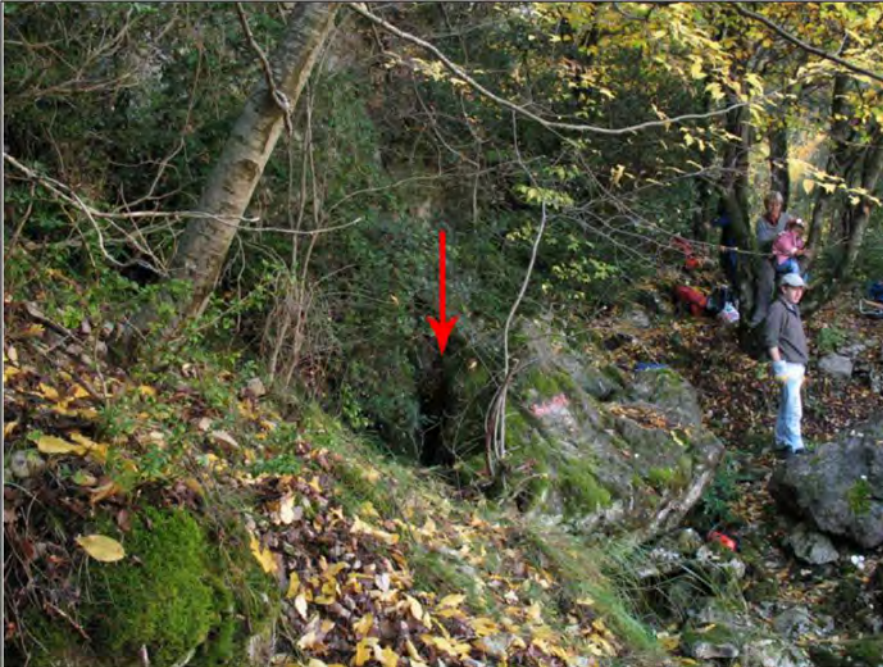
Entrée de la résurgence du Raï (+755 m NGF)