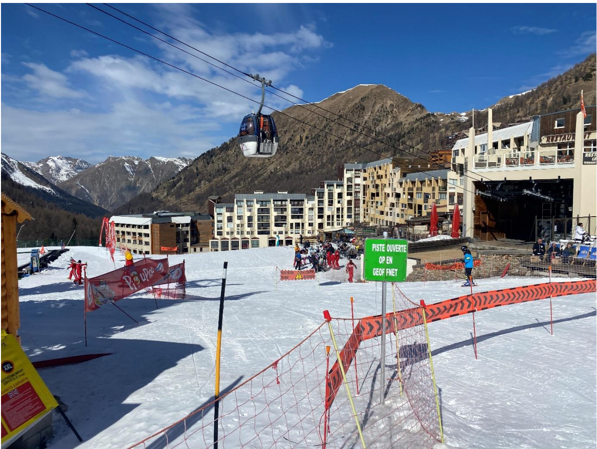
Figure 4 : Un site déjà fort exploité