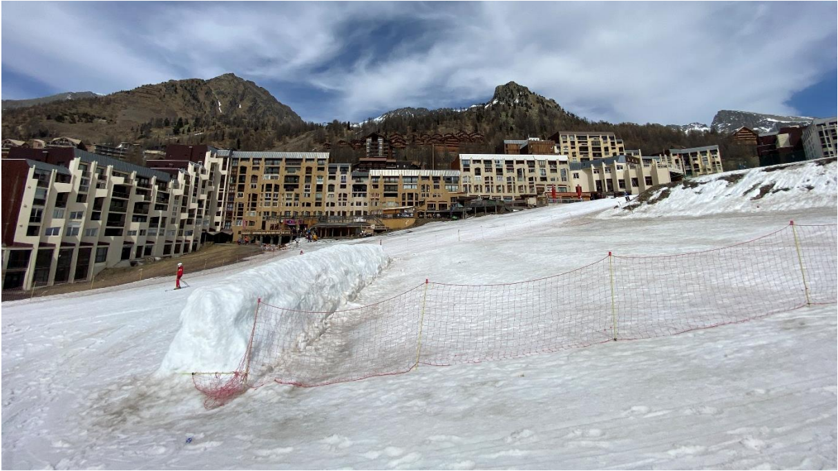
Figure 3 : Bas du front de neige en période hivernale