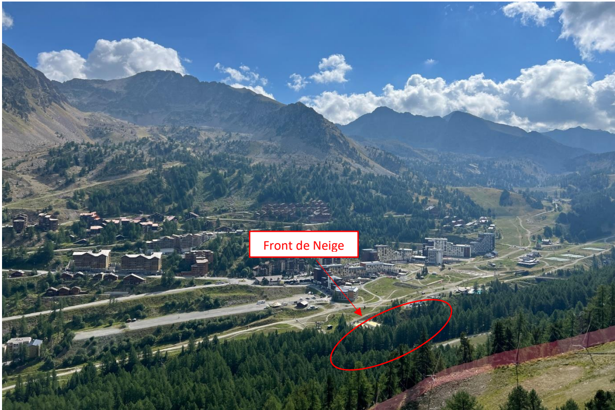
Figure 1 : Vue aérienne du front de neige de Isola 2000