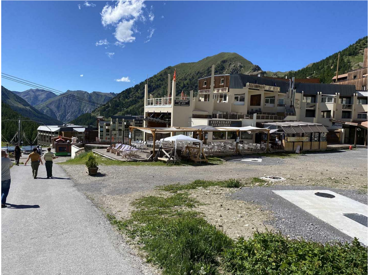
Figure 5 : Front de neige en période estivale