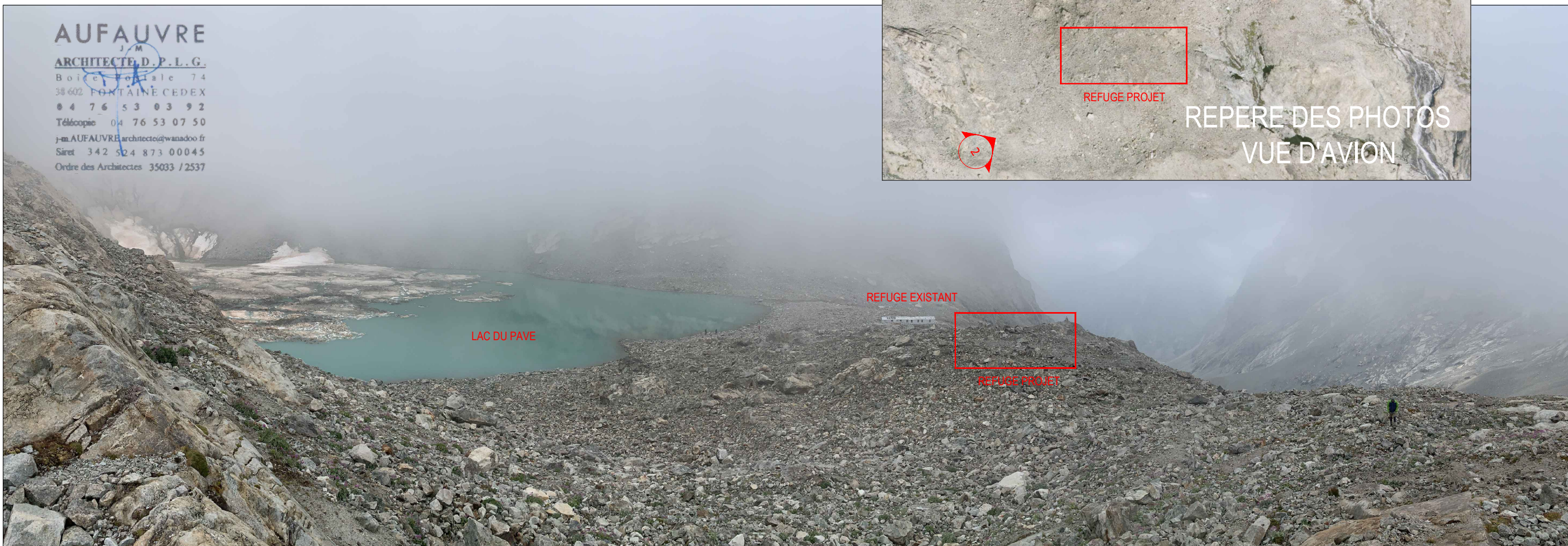
VUE ELOIGNEE 2 - SUD-OUEST

AUFAUVRE J.M. ARCHITECTE D.P.L.G. Boîte postale 74 38602 FONTAINE CEDEX 04 76 53 03 92 Télécopie 04 76 53 07 50 j-m.AUFAUVRE.architecte@wanadoo.fr Siret 342 524 873 00045 Ordre des Architectes 35033 / 2537