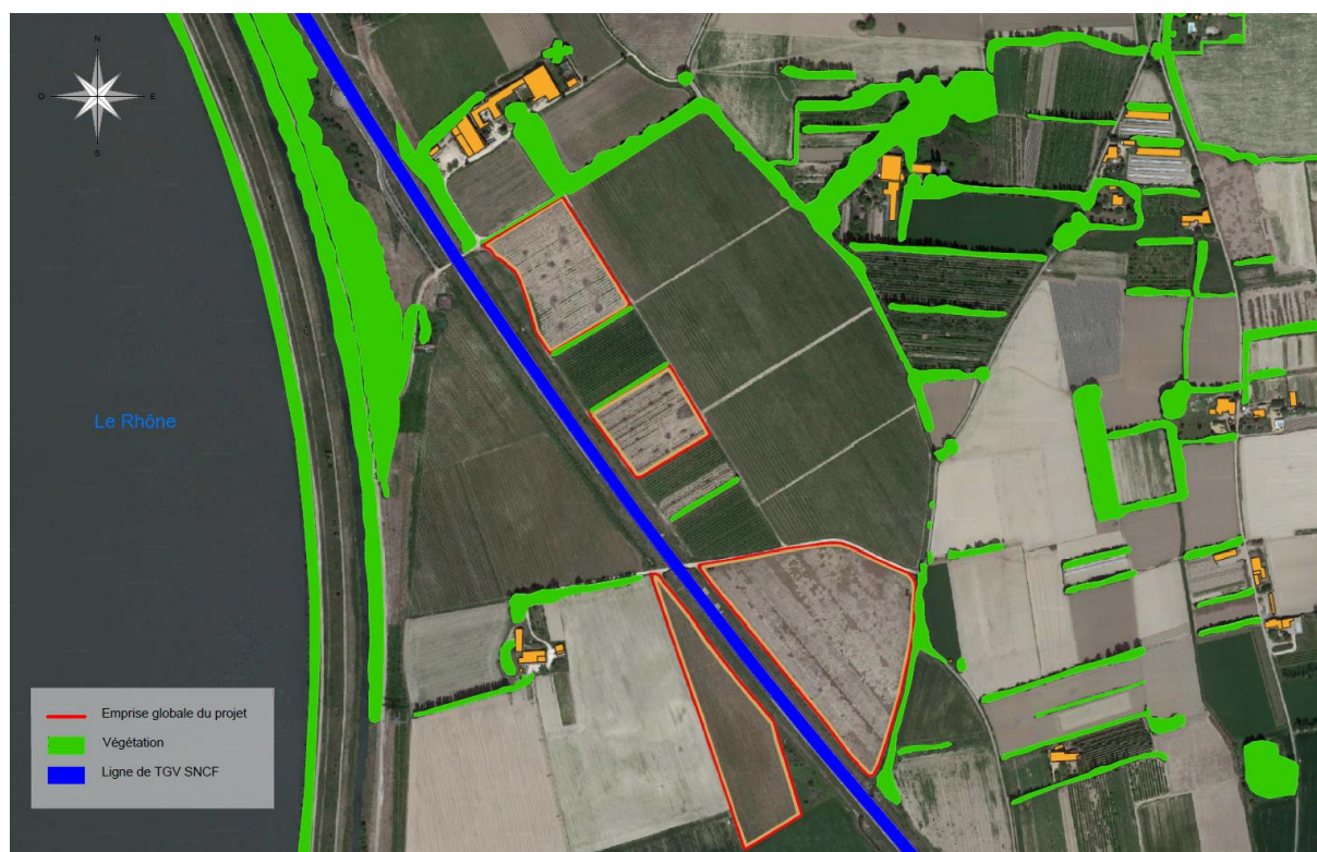
Figure 1 : Cartographie des éléments de paysage masquant naturellement le projet

Les alentours du site d'implantation du projet offrent des éléments de masque permettant d'isoler les structures photovoltaïques de leur environnement. On pourra principalement noter à l'ouest la ripisylve du Rhône, au centre la ligne à grande vitesse de la SNCF surélevée traversant le projet, et à l'est de nombreuses formations végétales. Ces formations sont pour la plupart des haies coupe-vent de grands arbres (notamment des cyprès et des peupliers), qui forment des masques très efficaces pour limiter très nettement la visibilité du projet depuis les environs.