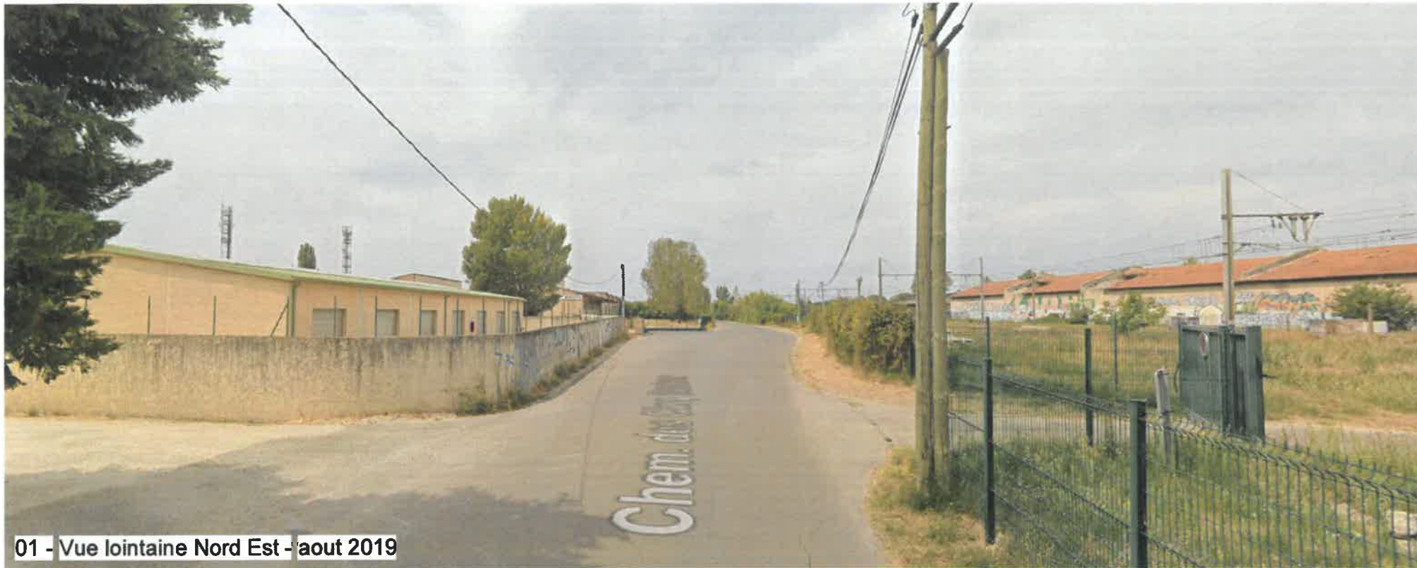
01 - Vue lointaine Nord Est - août 2019