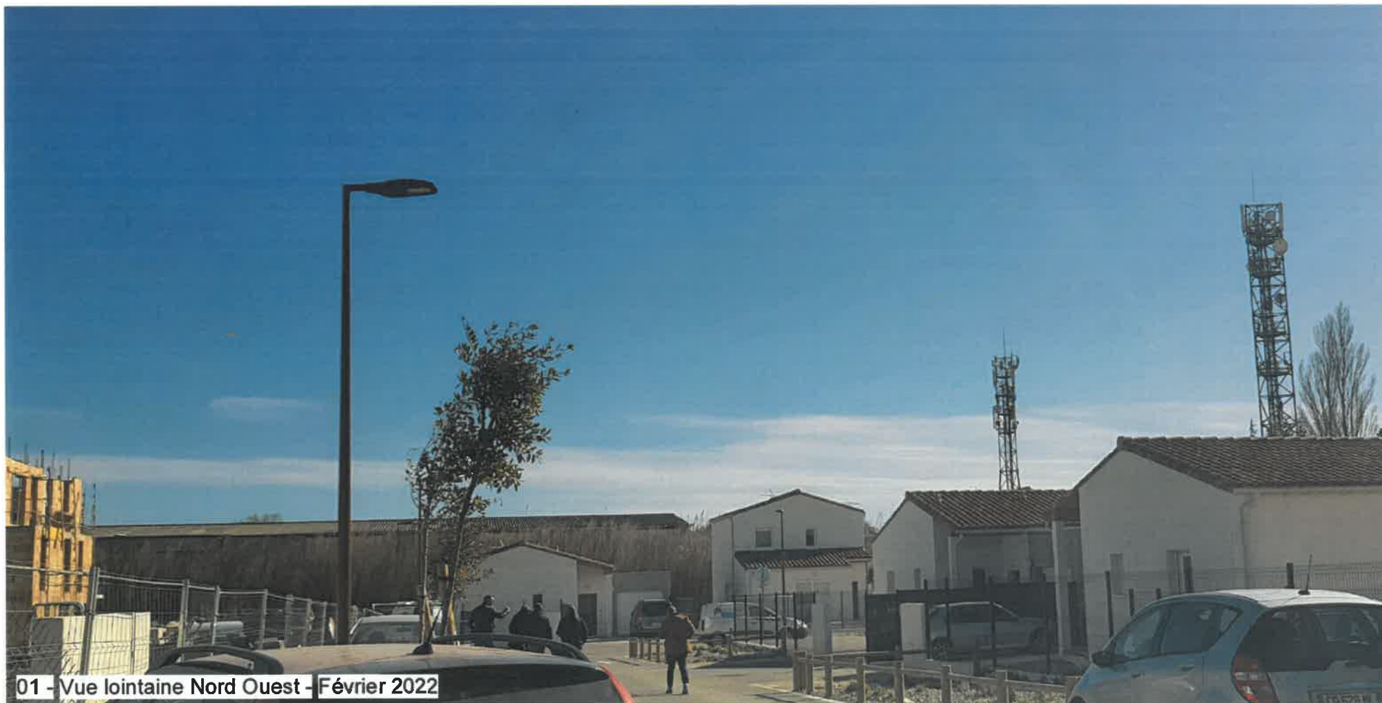
01 - Vue lointaine Nord Ouest - Février 2022