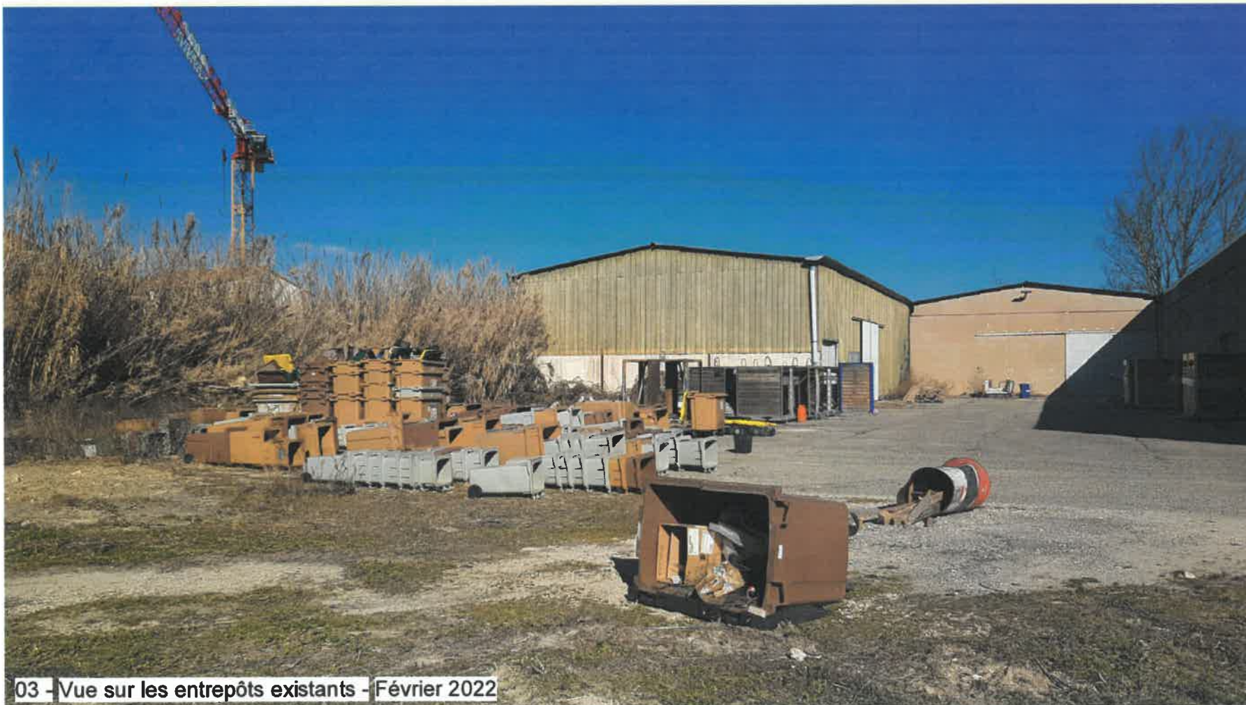
03 - Vue sur les entrepôts existants - Février 2022