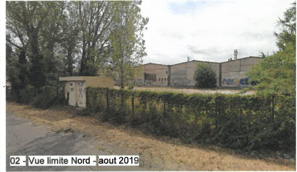
02 - Vue limite Nord - août 2019