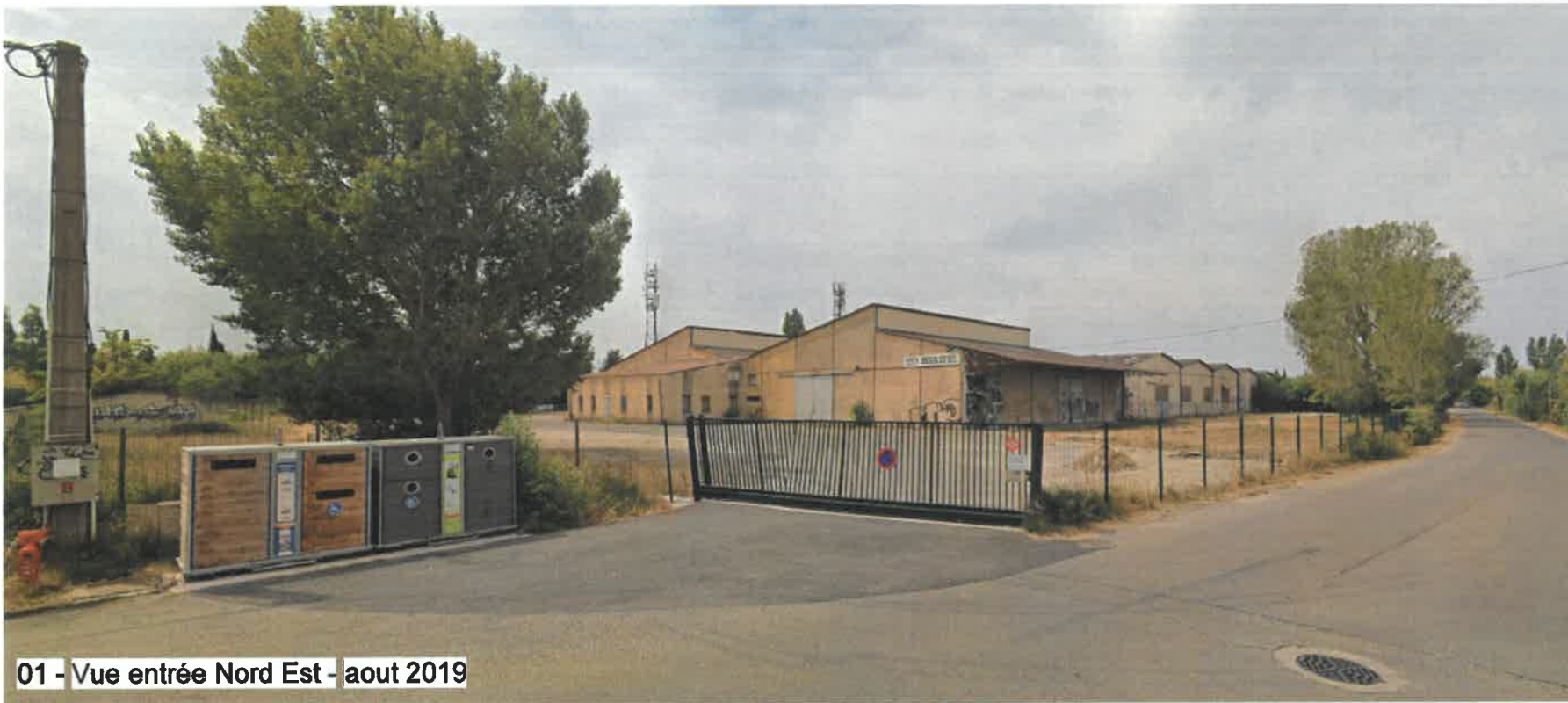
01 - Vue entrée Nord Est - août 2019