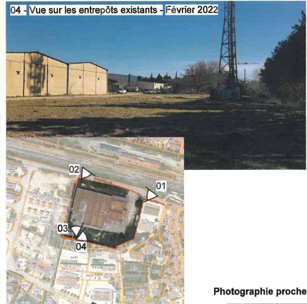
04 - Vue sur les entrepôts existants - Février 2022