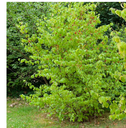
Cornus mas (cornouiller) Quantité : 67 u.