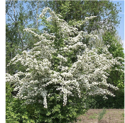
Crataegus monogyna (aubépine) Quantité : 67 u.