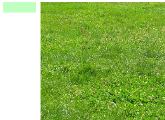
Prairie rustique Quantité : 1020 m 2