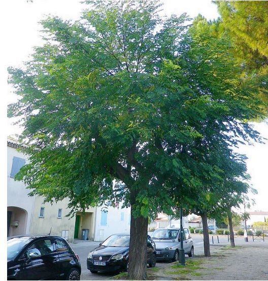
● Melia azedarach (lilas de Perse) - Force : 18-20 Quantité : 21 u.