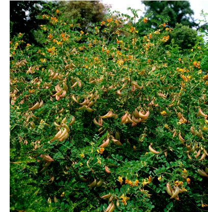
Colutea arborescens (bagueaudier) Quantité : 67 u.