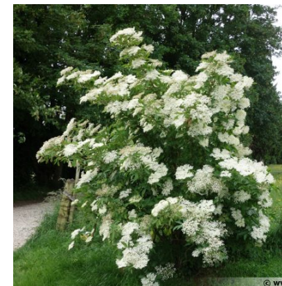
Sambucus nigra (sureau noir) Quantité : 67 u.