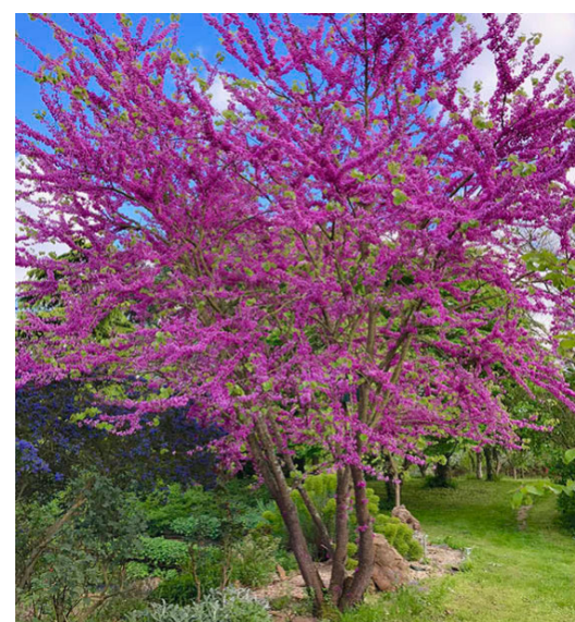
● Cercis siliquastrum (arbre de Judée) - Force : 25-30 Hauteur : 250/300 Quantité : 4 u.