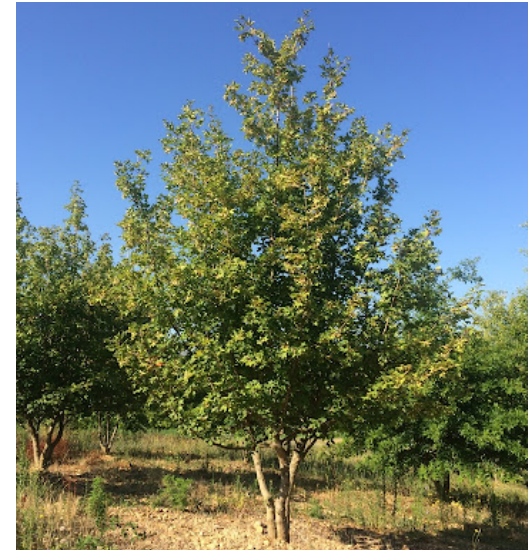
● Acer campestre (érable champêtre) - Force : 25-30 Hauteur : 250/300 Quantité : 4 u.