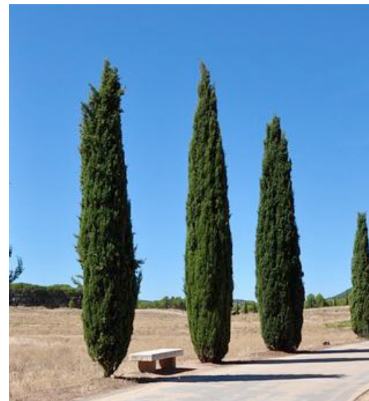
● Cupressus sempervirens (cyprés de Provence) - Hauteur : 250/300 Quantité : 6 u.