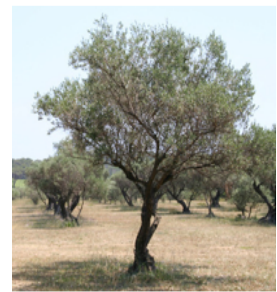
● Olea europaea (olivier) - Force : 16-18 Quantité : 2 u.