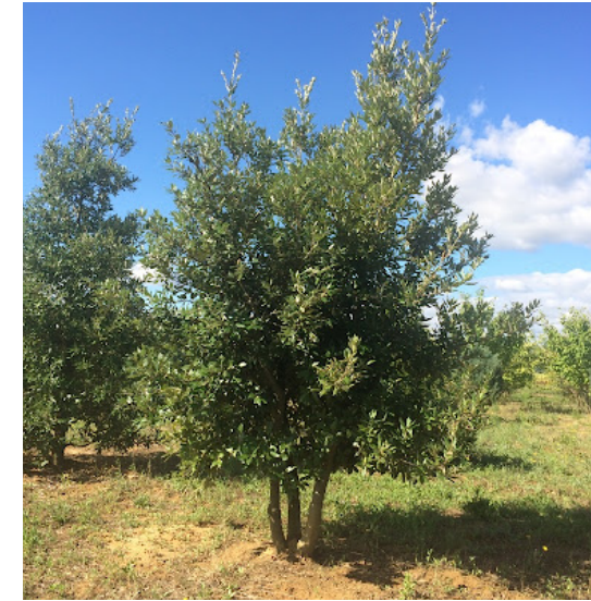
● Quercus ilex (chêne vert) - Force : 25-30 Hauteur : 250/300 Quantité : 7 u.