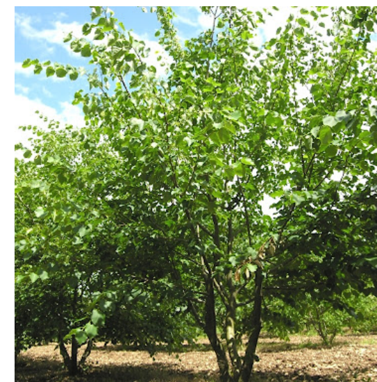
● Tilia cordata (tilleul) - Force : 25-30 Hauteur : 250/300 Quantité : 5 u.