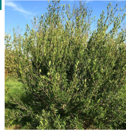
Phillyrea angustifolia (filaire) Quantité : 67 u.