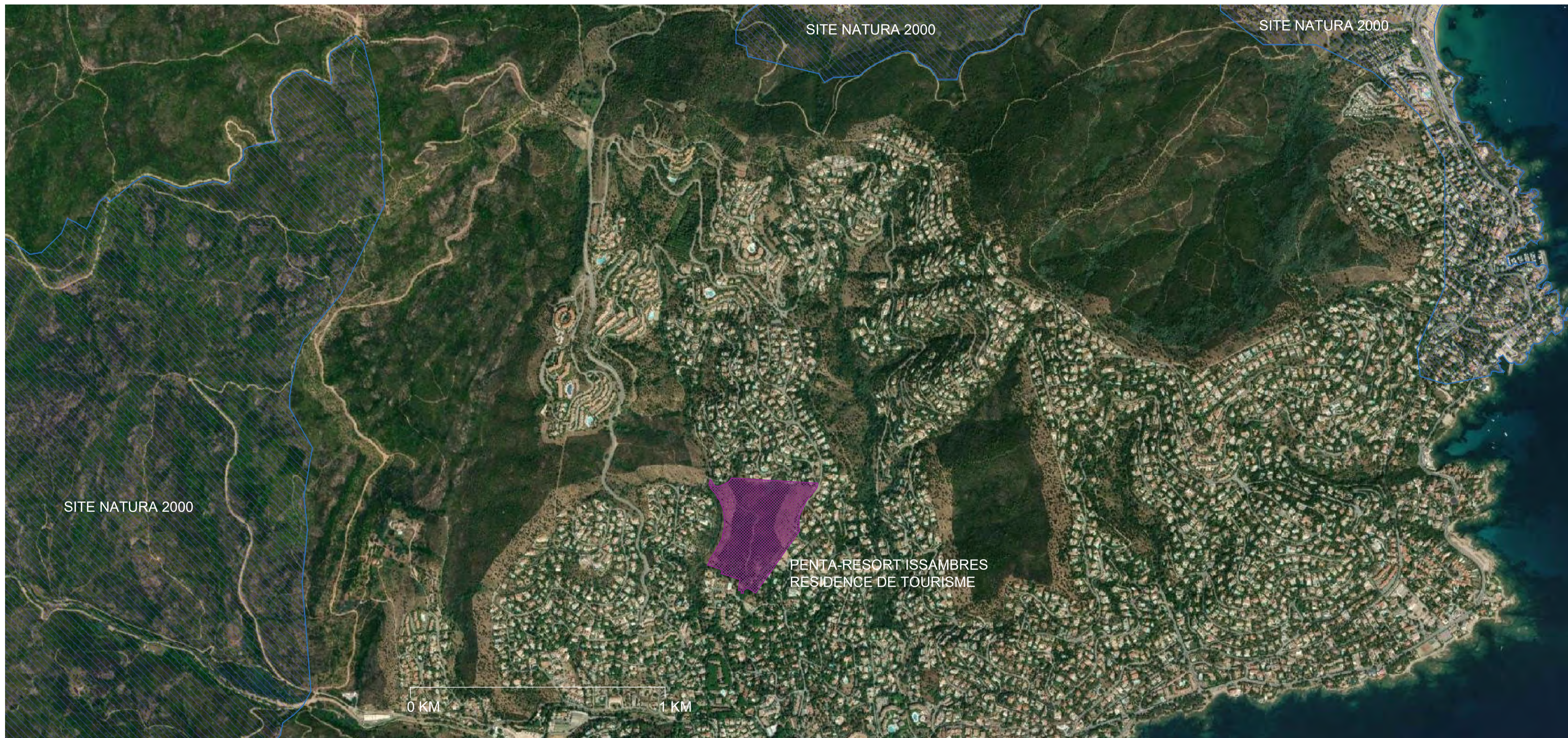
PLAN DE SITUATION DU PROJET PAR RAPPORT AUX SITES NATURA 2000. 1:10000