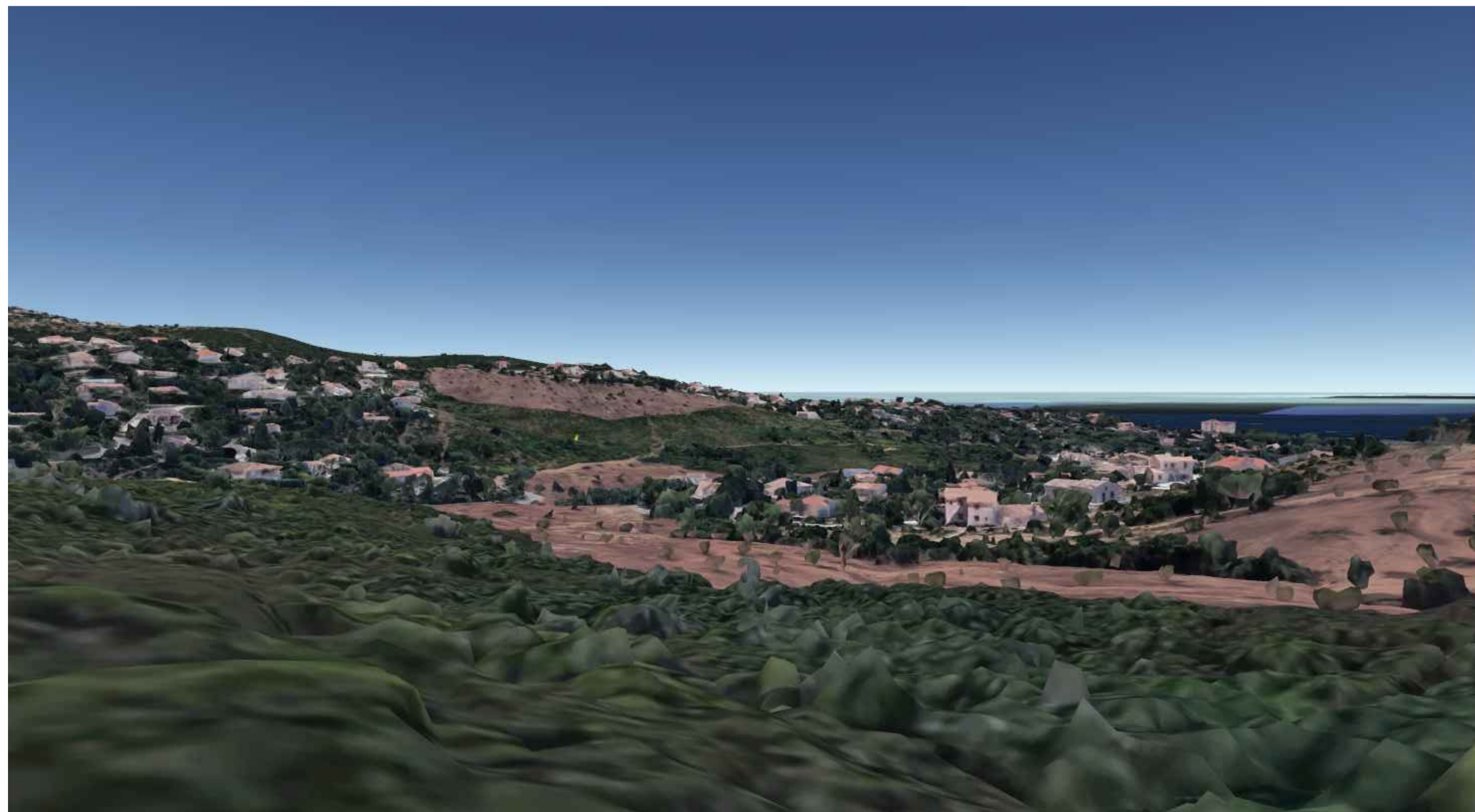
ENVIRONNEMENT LOINTAIN. SEPTEMBRE 2019