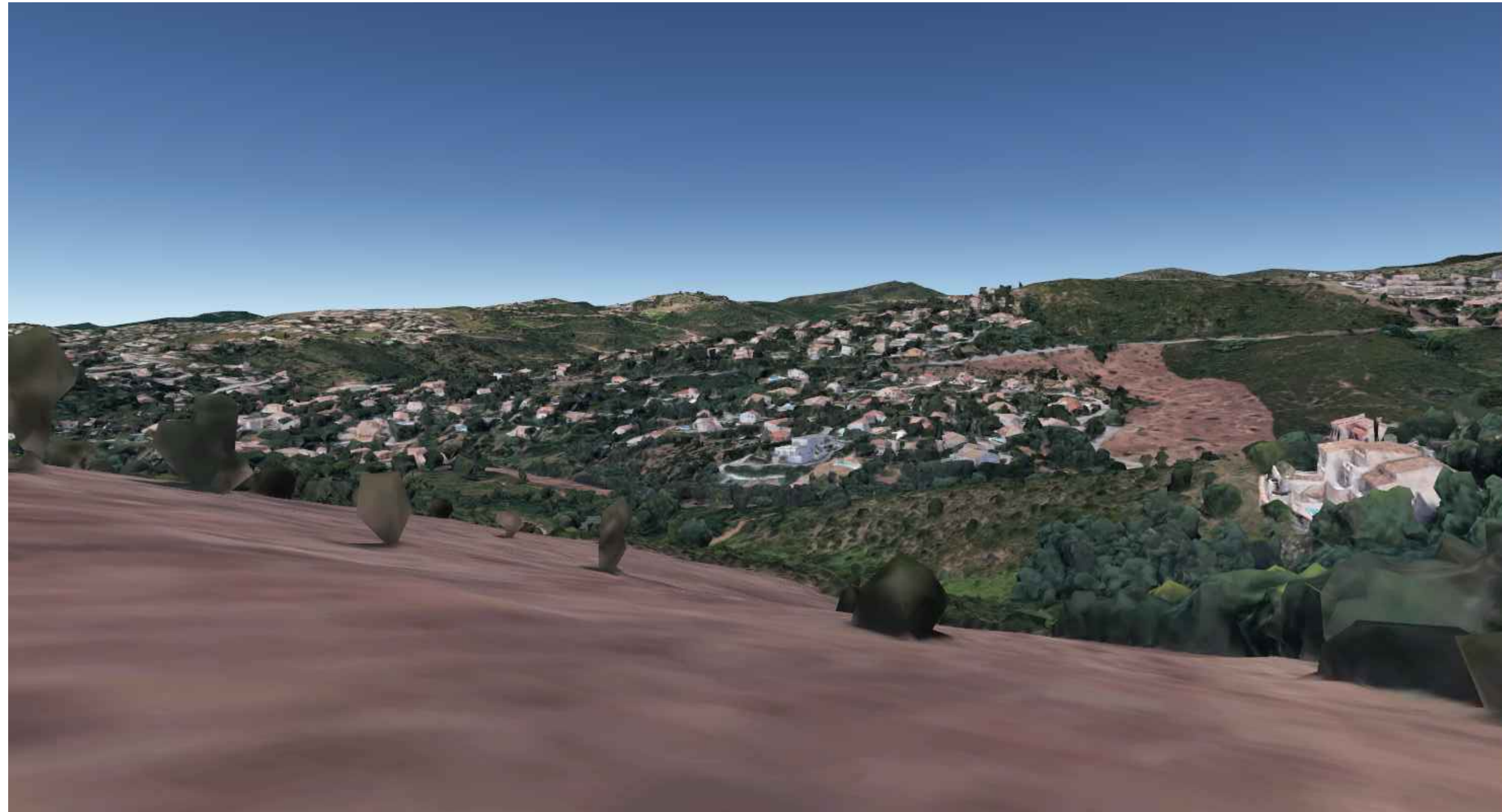
ENVIRONNEMENT PROCHE. SEPTEMBRE 2019