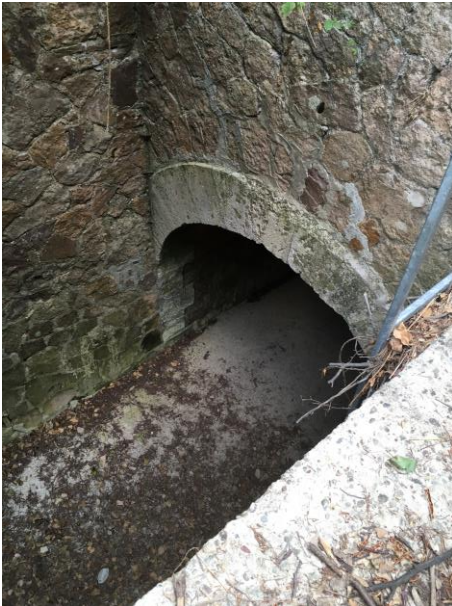
Début tronçon canalisé du Vallon

La portion enterrée du vallon traversant l'emprise du projet est constitué d'un ouvrage route de section variable, se réduisant lentement pour tendre vers une section circulaire d'environ 2 mètres de diamètre à l'aval du projet.