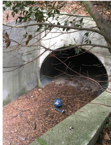
Tronçon canalisé (amont emprise projet)

Cet ouvrage de gestion des eaux pluviales se situe dans l'emprise du futur parc de stationnement, il est donc nécessaire de réaliser son dévoiement.