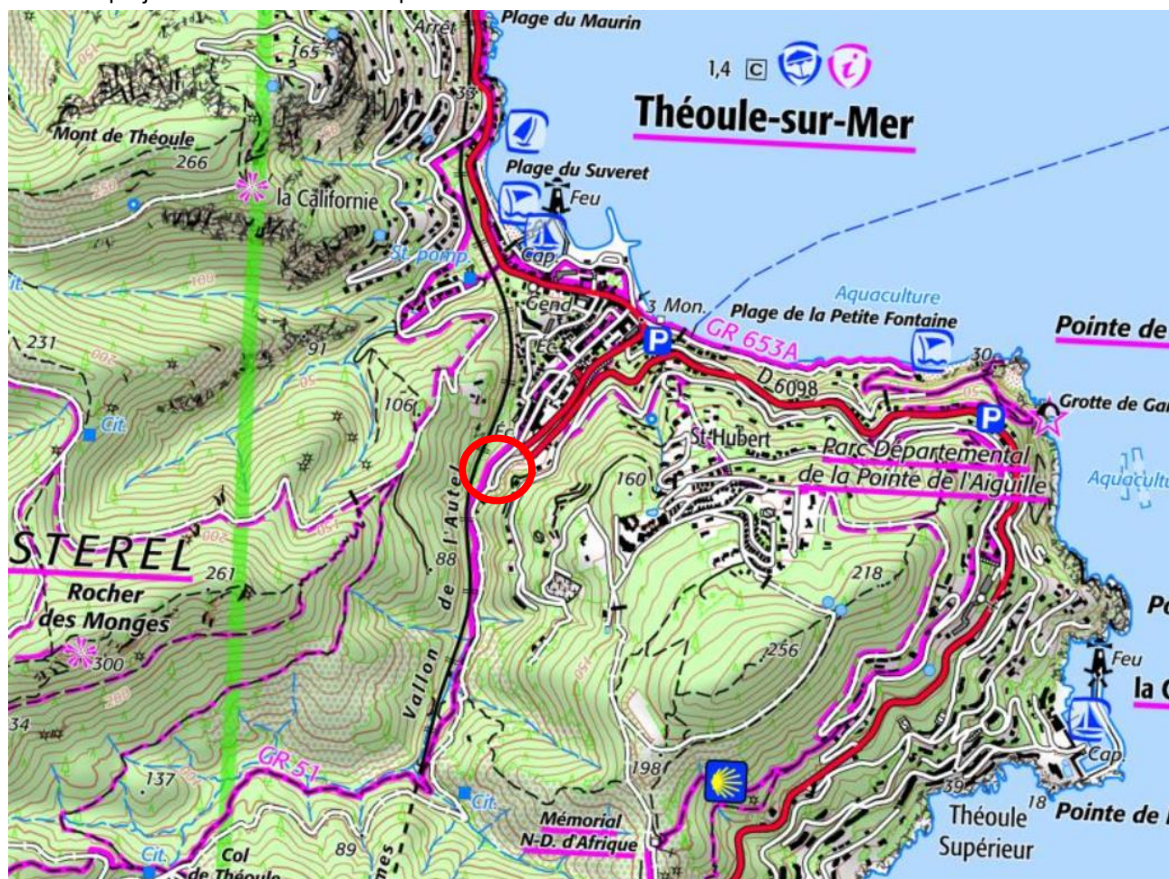
Plan de situation du projet

La présente note a pour objet de présenter les travaux de dévoiement du vallon de l'Autel à réaliser dans le cadre du projet de construction d'un parc de stationnement sur la commune de Théoule sur Mer.