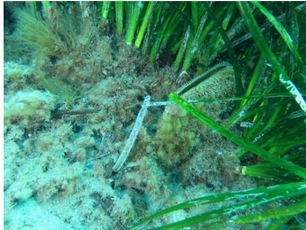
Figure 2 : Grande nacre sur la matte de posidonie à l'interface de la zone de sable sur T1

Les cartographies présentées ci-après localisent les habitats et biocénoses relevées au droit de la plage du Rayol par H2O Environnement, ainsi que la cartographie des habitats élémentaires issue du DOCOB de la zone Natura 2000 de la Corniche varoise.