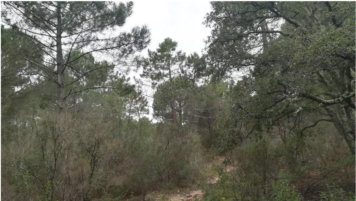
Prise de vue 4