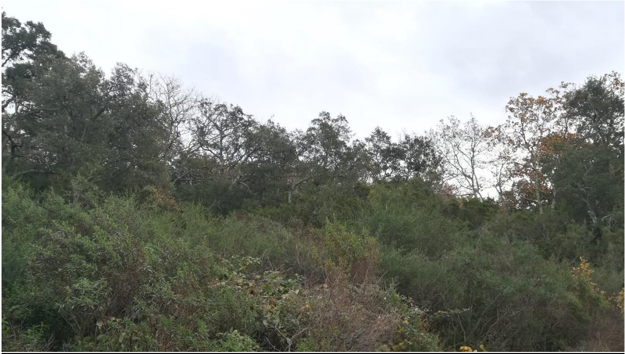
Prise de vue n°1