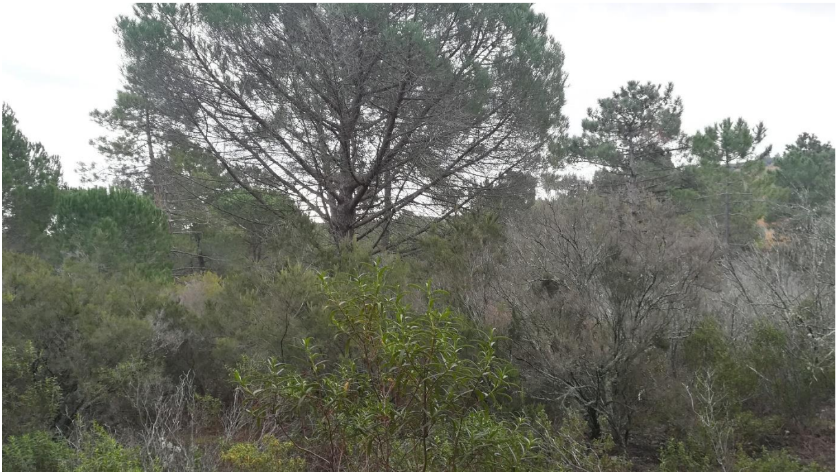
Prise de vue 2