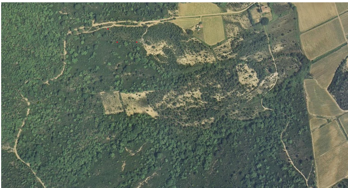
Vue aérienne de 1979