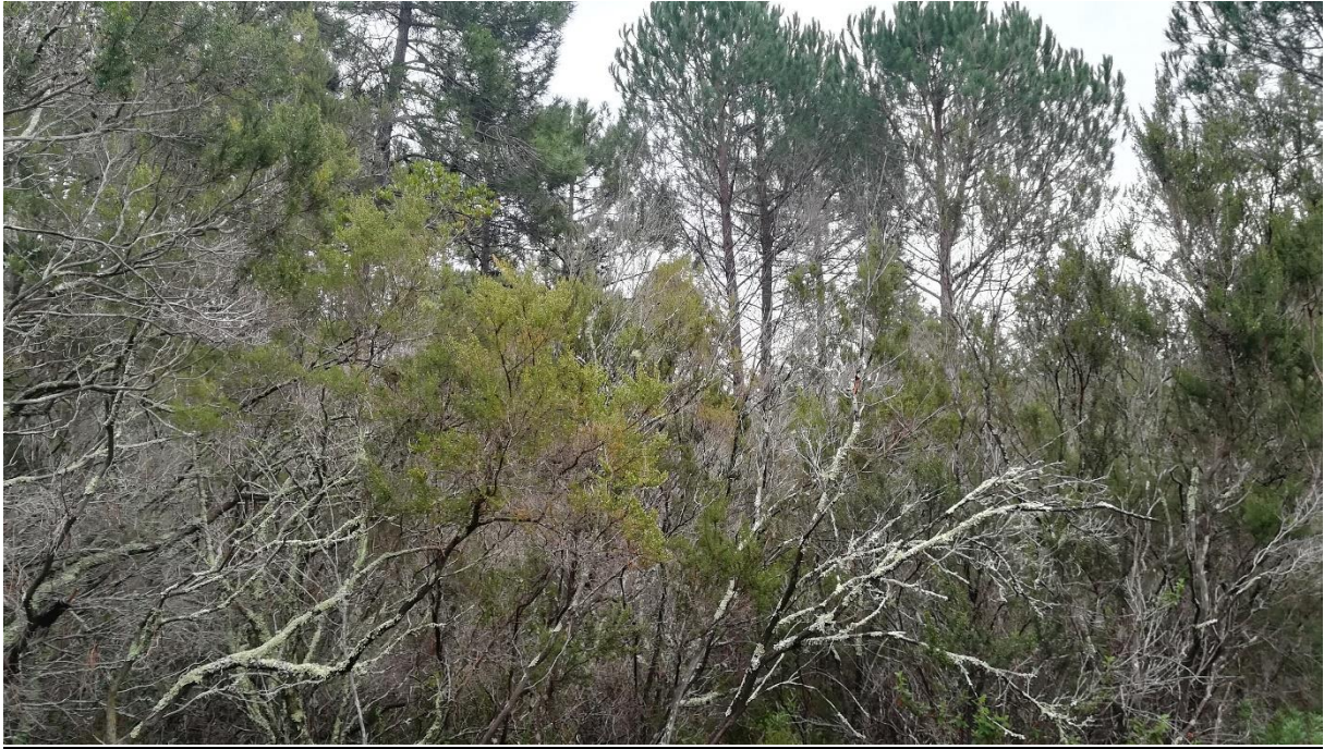
Prise de vue 3