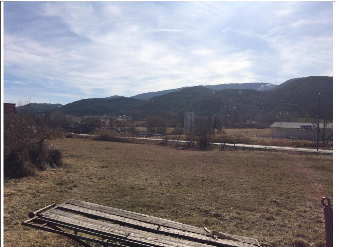
1 – le 11/03/2019