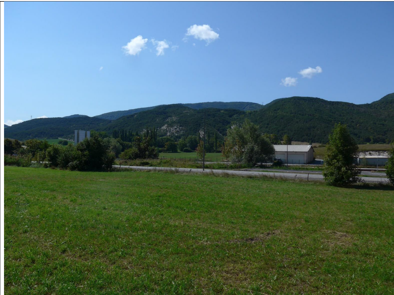
1- Le 04/09/2018

ANNEXES – Pièce N°3 : photographies datées de la zone d'implantation