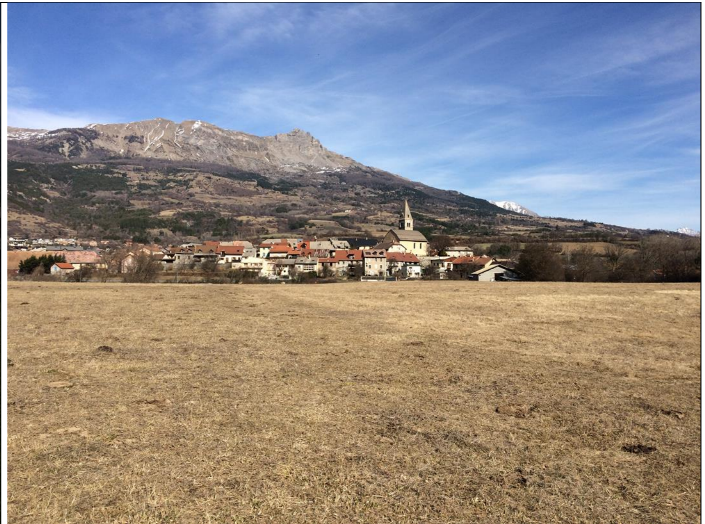
2- Le 04/09/2018