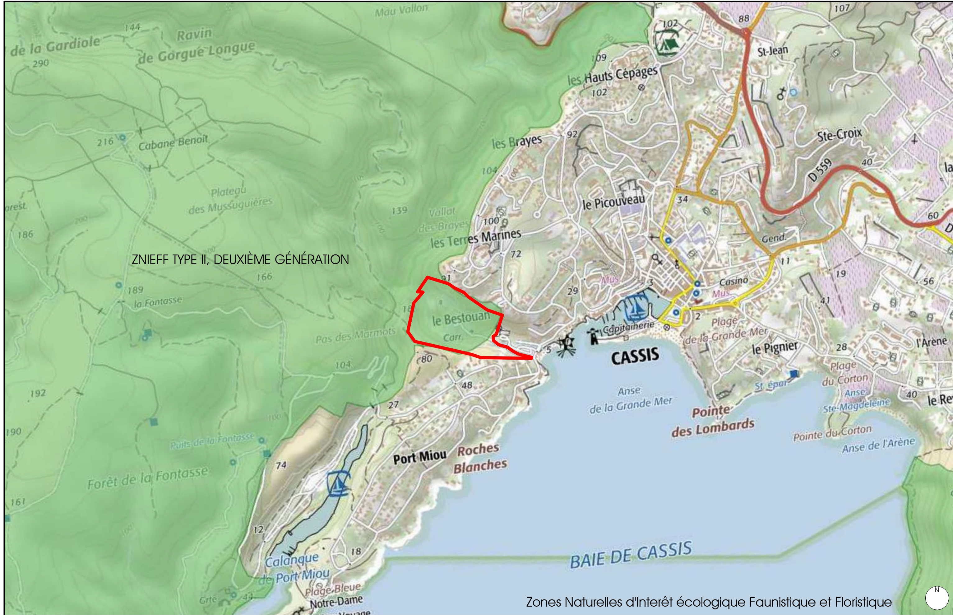
Zones Naturelles d'Interêt écologique Faunistique et Floristique