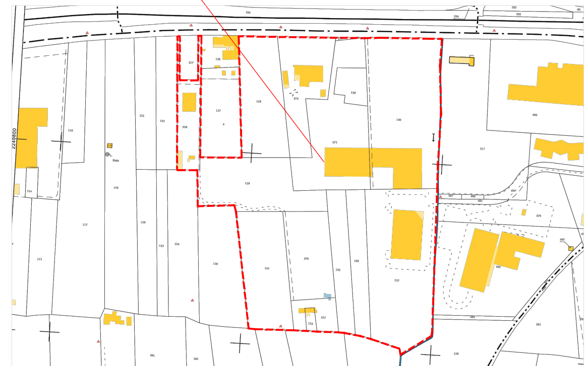
cadastre - ech. 1/4000

SARL GRAMA Centre COMMERCIAL St Jean 83170 BRIGNOLES Siret : 484 156 989 00010