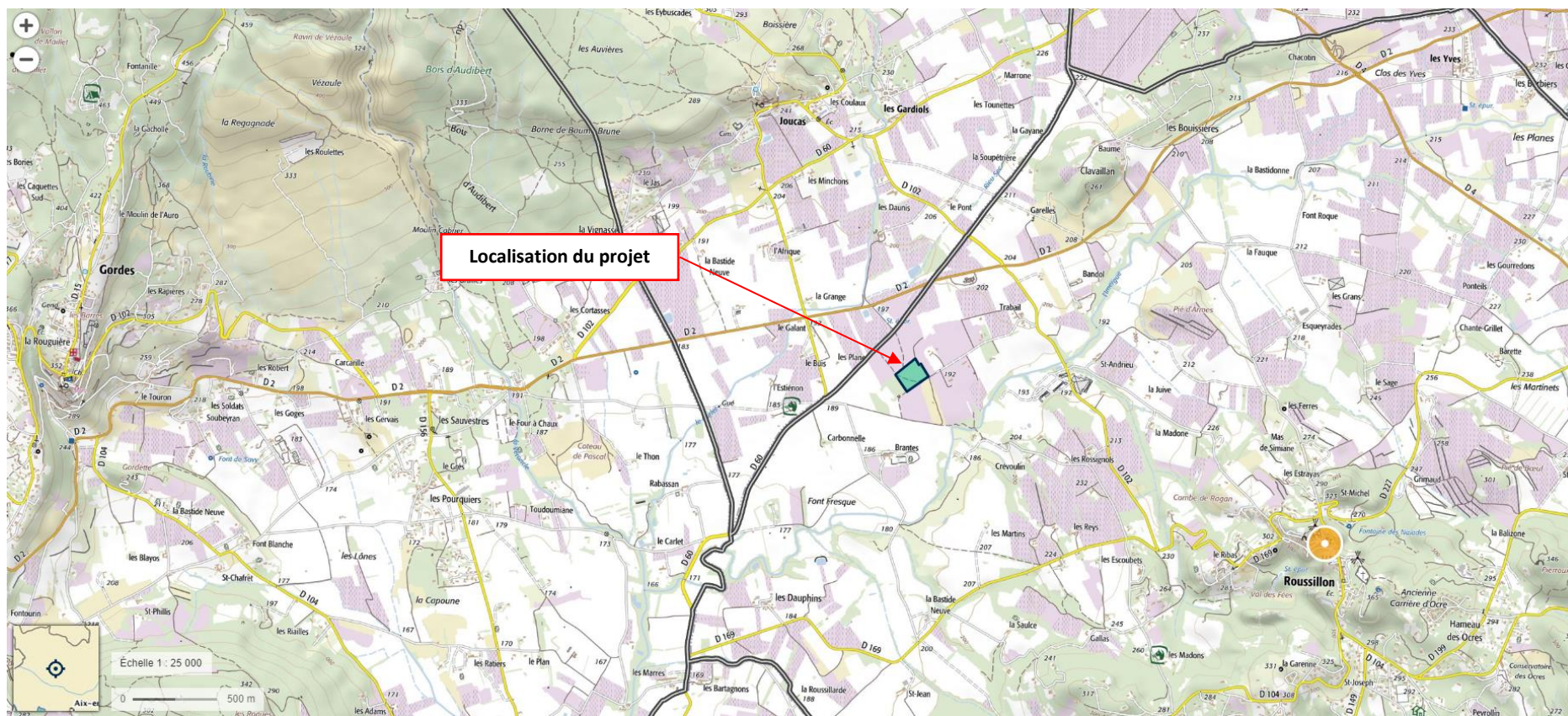
Figure 1 : Localisation du site

Lieu d'implantation de la serre agricole photovoltaïque : Lieu-dit « Plan de l'Imergue », 84220 ROUSSILLON.