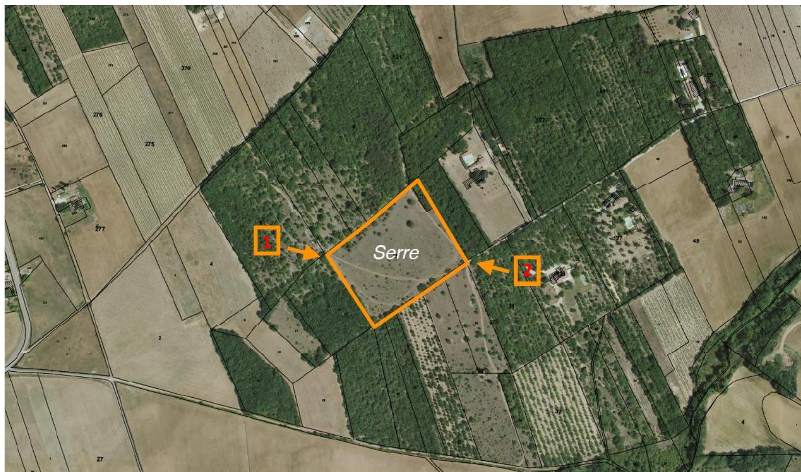
Figure 2 : Localisation des points de vue rapprochés

Localisation des points de vue rapprochés (immédiats).