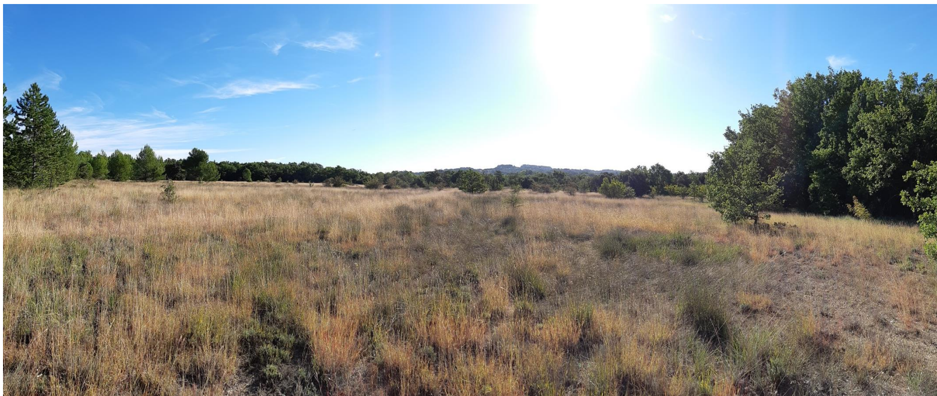
Figure 3 : Prise de vue rapprochée n°1

Prise de vue rapprochée n° 1 (prise de vue 03/10/2018) : vue depuis l'angle Nord-Ouest de la parcelle n°15.