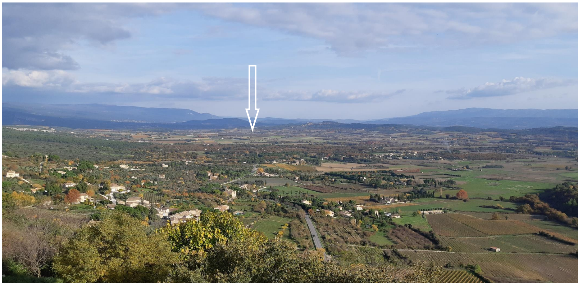
Figure 6 : Prise de vue éloignée n°1

Prise de vue éloignée n° 1 (prise de vue 13/11/2018) : vue depuis les pentes du village de Gordes (rue André Lhote).