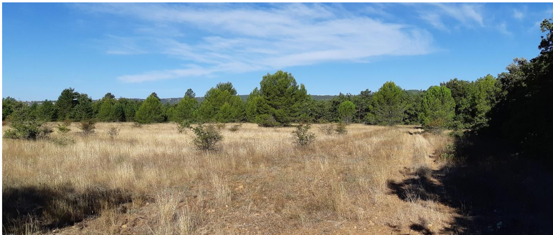
Figure 4 : Prise de vue rapprochée n°2

Prise de vue rapprochée n° 2 (prise de vue 03/10/2018) : vue depuis l'angle Sud-Est de la parcelle n°15.