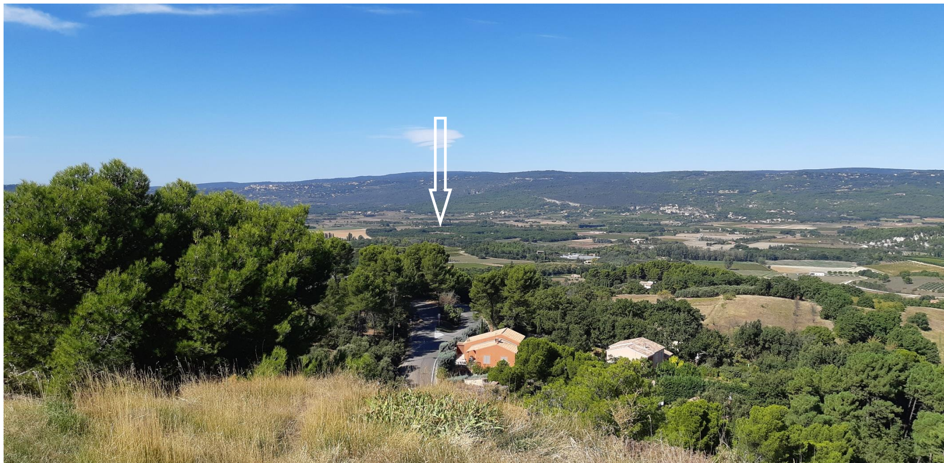
Figure 7 : Prise de vue éloignée n°2

Prise de vue éloignée n° 2 (prise de vue 03/10/2018) : vue depuis le belvédère du village de Roussillon