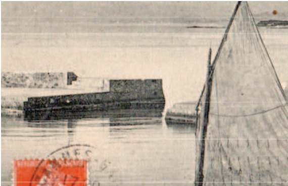
Fig. C•33 - Emmarchement d'accès au musoir occidental en 1908