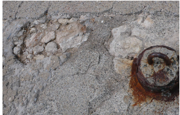
Fig. C•34 - Revêtement du sol primitif visible dans les lacunes de la chape de ciment

La face orientale de l'ouvrage présente un désordre en son milieu (fig. C•35). La face nord, au parement enduit lacunaire, montre la structure de gros moellons de l'ouvrage (fig. C•36).