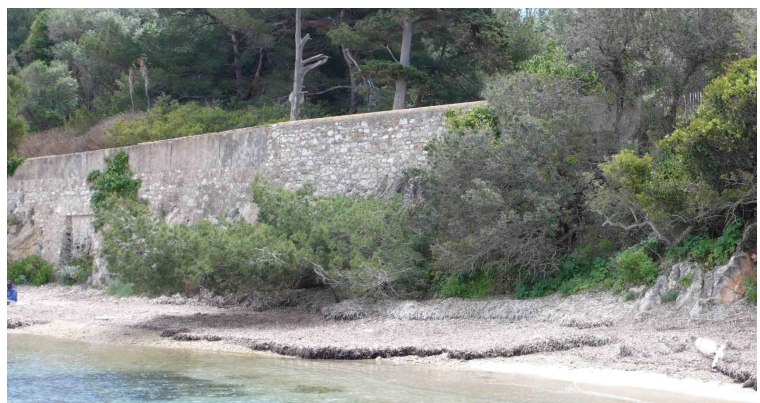
Fig. C•37 - La plage (OP06)

Le quai oriental prend naissance à l'extrémité de la plage de sable (OP06) (fig. C•37).