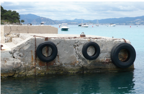
Fig. C•35 - Elévation du musoir sur la passe d'entrée

La face orientale de l'ouvrage présente un désordre en son milieu (fig. C•35). La face nord, au parement enduit lacunaire, montre la structure de gros moellons de l'ouvrage (fig. C•36).