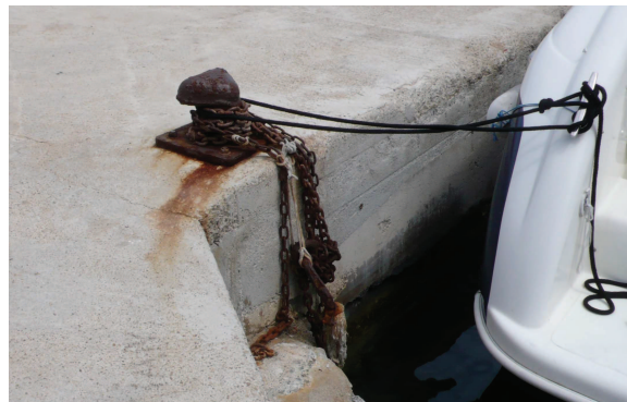
Fig. C•27 - Elévation sud dans le bassin