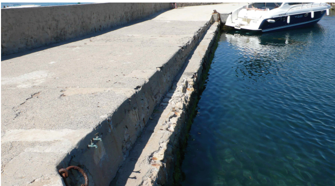
Fig. C•23 - Segment OP04 du quai occidental

Le revêtement du quai présente la même finition, en très mauvais état (fig. C•24 & C•25). Des anneaux forgés, pour scellement d'organeaux, ont résisté aux réparations. Le dos du muret de maçonnerie, dont la face côté port est enduite et celle côté mer laissée nue, est protégé par un enrochement installé dans les années 1960 (OP02). Dans l'enduit frais, une "main experte" a signé "2001".