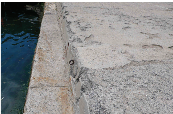
Fig. C•24 - Revêtement du quai et la marche en chape de béton altérée

Le revêtement du quai présente la même finition, en très mauvais état (fig. C•24 & C•25). Des anneaux forgés, pour scellement d'organeaux, ont résisté aux réparations. Le dos du muret de maçonnerie, dont la face côté port est enduite et celle côté mer laissée nue, est protégé par un enrochement installé dans les années 1960 (OP02). Dans l'enduit frais, une "main experte" a signé "2001".