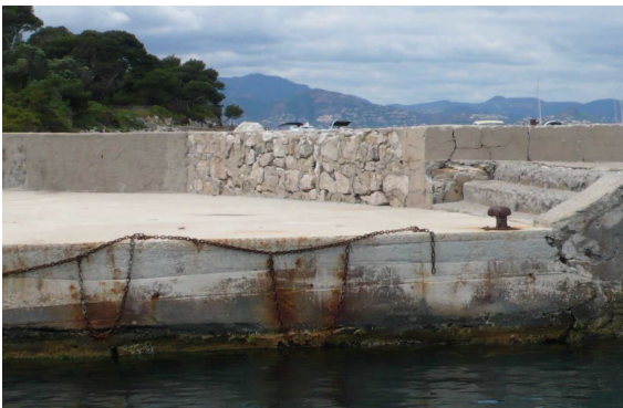
Fig. C•26 - Elévation dans la passe d'entrée

Le segment OP03 conduit au musoir et à la passe d'entrée. Des travaux de confortement récents ont reconditionné la rive (côté passe et côté port) en disposant des longrines en béton (fig. C•26) et en condamnant, de fait, l'embranchement (fig. C•27). Le revêtement de surface, toujours en béton, est lissé. Une signature, dans le béton frais, semble dater ces travaux de 2009.