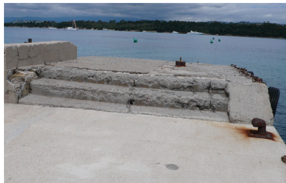
Fig. C•32 - Emmarchement d'accès au musoir occidental

Pour accéder au musoir (OP01), il faut gravir deux hauteurs de marches (fig. C•32). Ces marches occupent toute la largeur du musoir, mais leur nombre a été réduit par la surélévation du quai (fig. C•33). La plate-forme, de 4,35 m par 4,87 m est recouverte d'une vieille chape de béton qui dévoile, dans ses lacunes, le sol de pierres d'origine (fig. C•34).