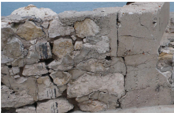
Fig. C•30 - Désordre dans la maçonnerie du muret