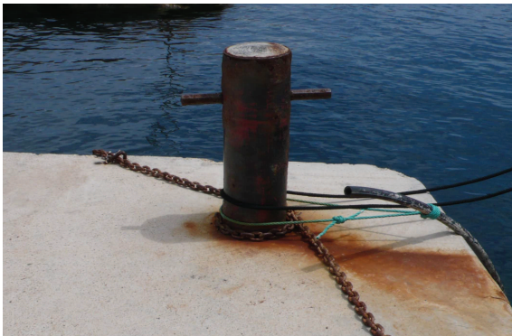
Fig. C•28 - Dispositif d'amarrage

Les dispositifs d'amarrage renvoient à ces travaux récents (fig. C•28). Le muret, prolongement du précédent, n'est pas enduit et dévoile une maçonnerie de moellons de gros calibres, partiellement désorganisés (fig. C•29 & C•30). Au revers, le mur présente un empattement en partie masqué par l'enrochement (fig. C•31).