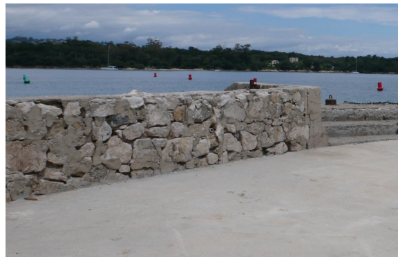
Fig. C•29 - Muret de protection en maçonnerie