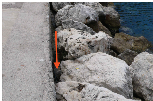
Fig. C•31 - Empattement à la base du muret côté mer