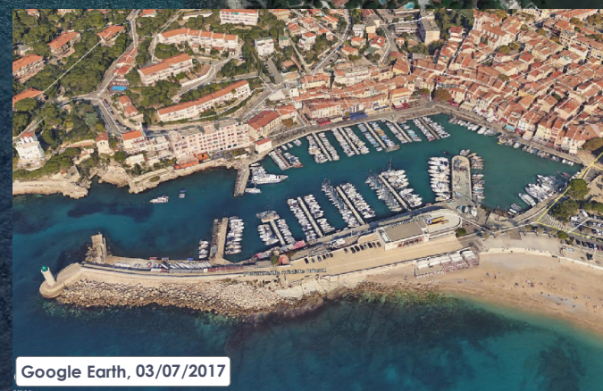
Google Earth, 03/07/2017