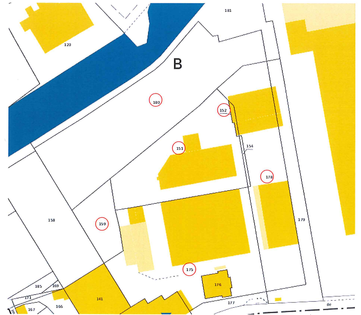
Section 857D Parcelles n°151, 152, 159, 175, 178, 180