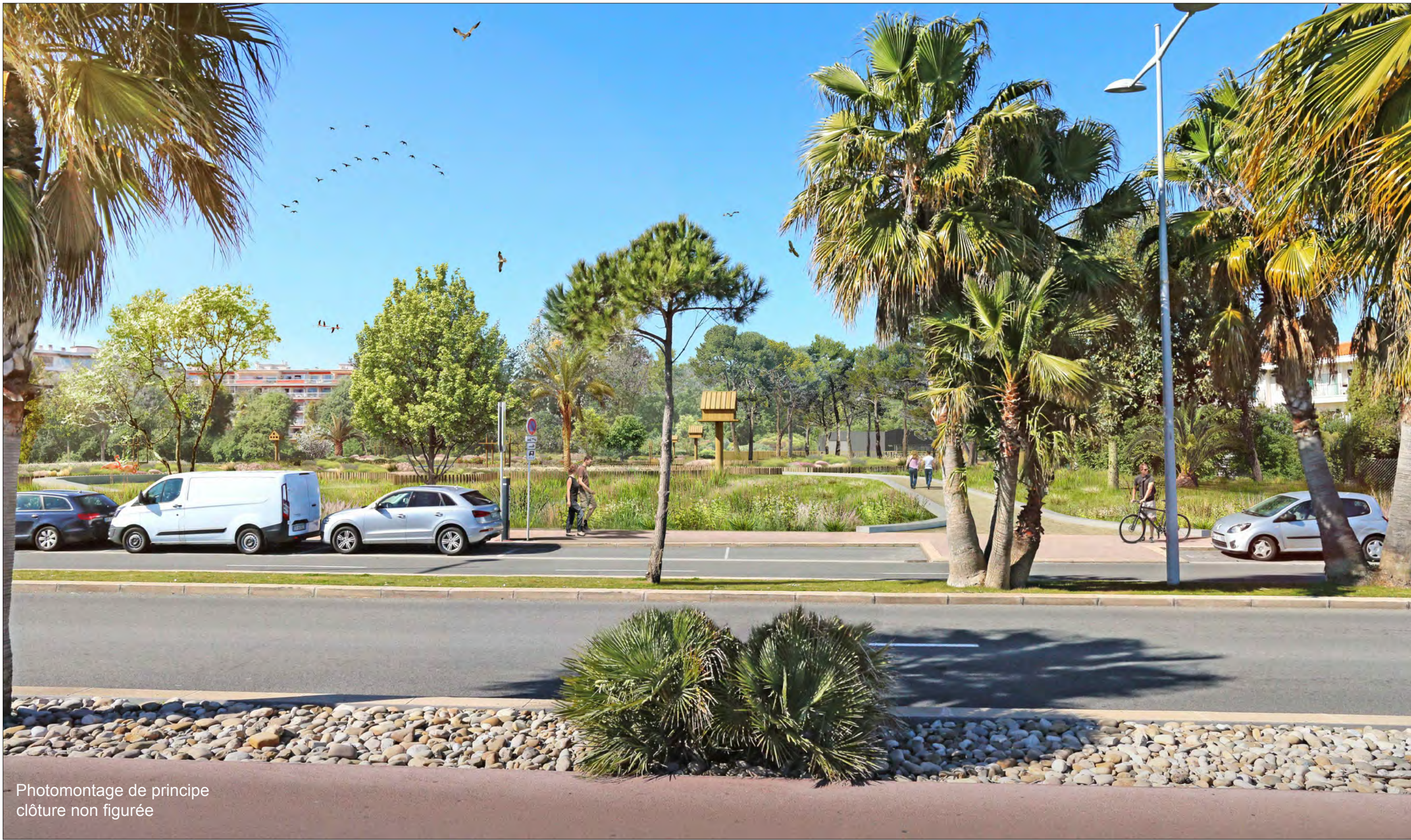
Photomontage de principe clôture non figurée