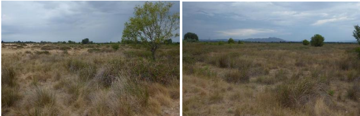
Zone embroussaillée

L'origine de l'humidité de cette zone n'est encore pas clairement déterminée. Plusieurs facteurs peuvent intervenir : infiltration ou débordement du canal voisin, irrigation des prairies de foin de Crau au nord du site, affleurement de la nappe phréatique de Crau.