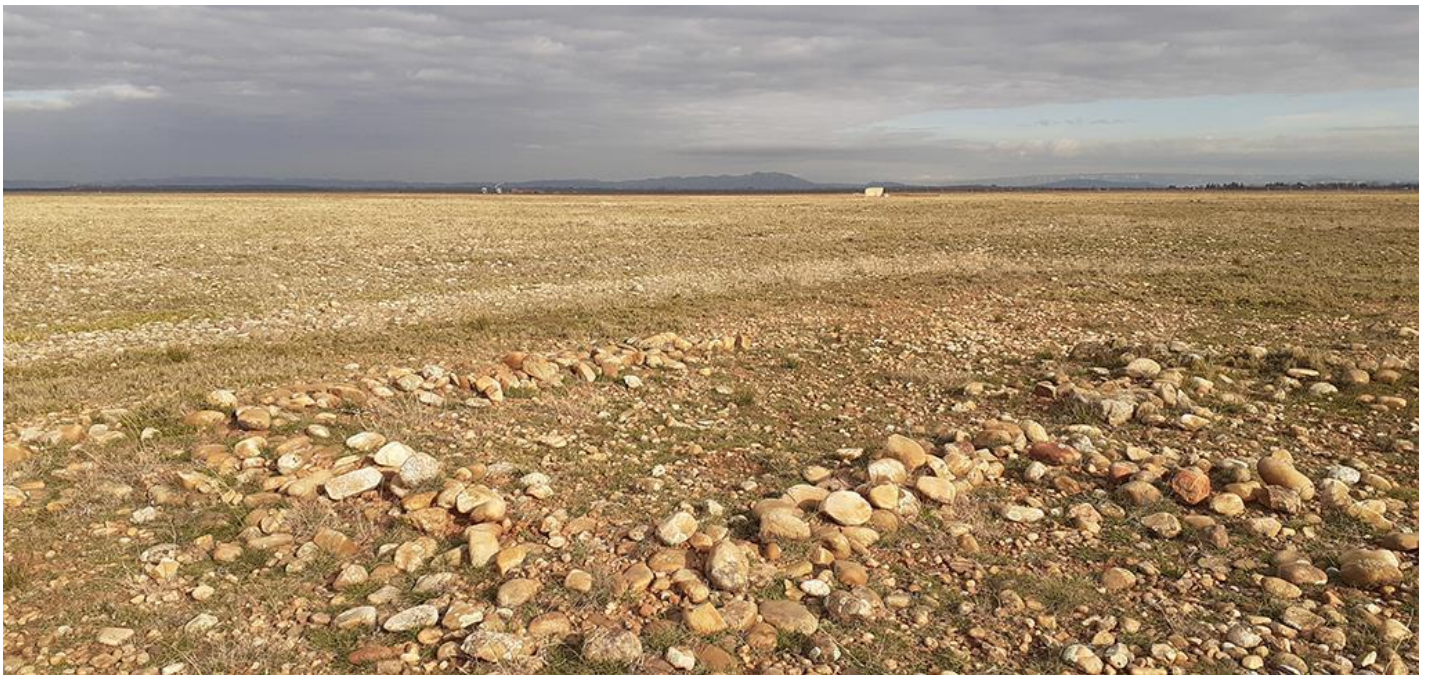
Les coussouls, pelouses sèches de la Plaine de la Crau