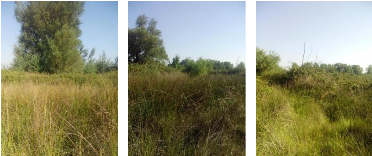
Zone fortement embroussaillée