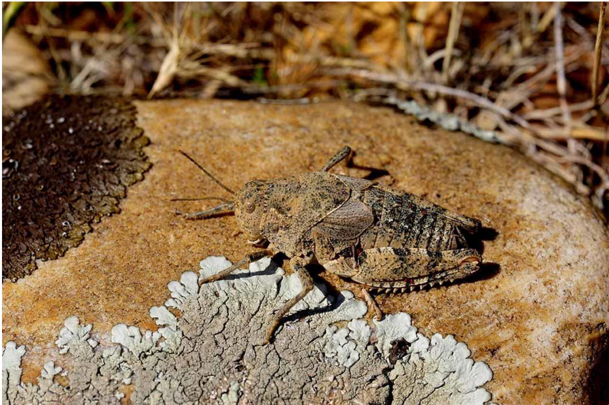
Femelle du Criquet de Crau

Le Conservatoire d'espaces naturels de Provence-Alpes-Côte d'Azur, la Chambre d'agriculture des Bouches-du-Rhône, les parcs zoologiques de La Barben et de la Citadelle de Besançon ont obtenu, en septembre 2021, le feu vert de la Commission européenne pour démarrer le projet LIFE SOS Criquet de Crau. S'étalant sur quatre ans (2021-2025), ce projet vise la sauvegarde du Criquet de Crau Prionotropis rhodanica , espèce endémique de la plaine de la Crau et en danger critique d'extinction. Le Criquet de Crau est une espèce « clé », le sauvegarder, c'est sauvegarder tout un écosystème.