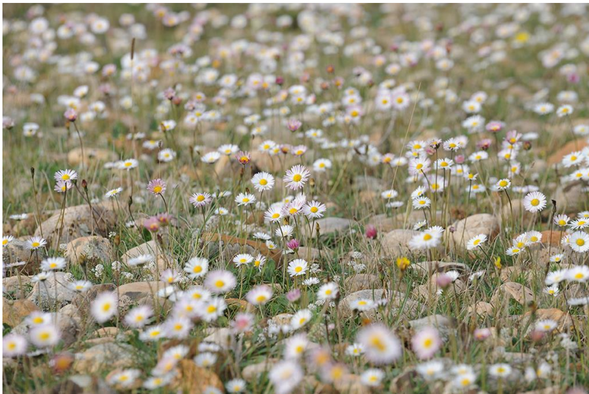
Plaine de la Crau