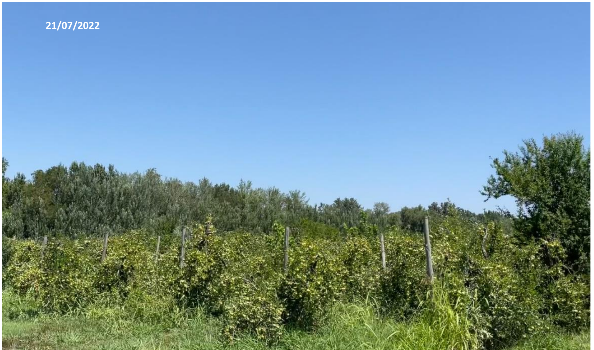
Point de vue n°1 (zone 1)