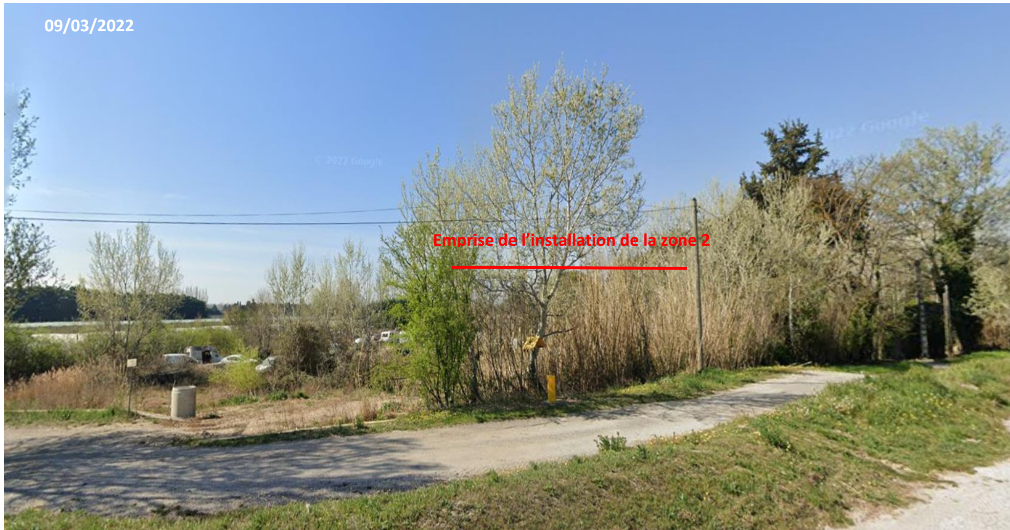
Point de vue n°4