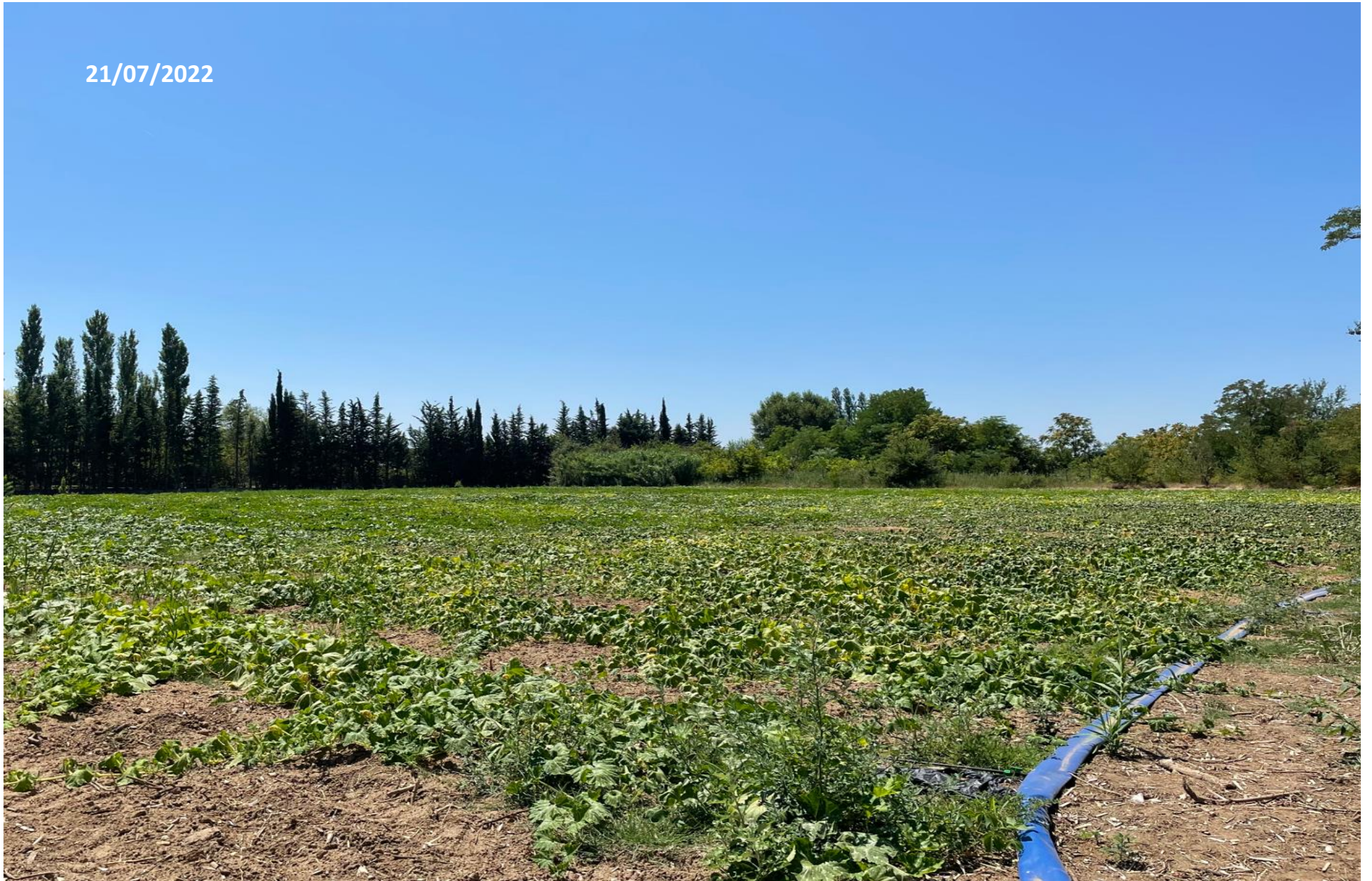
Point de vue n°3 (zone 2)