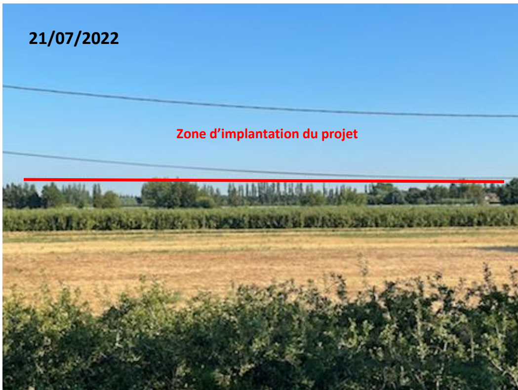
Point de vue n°2 (lointain)