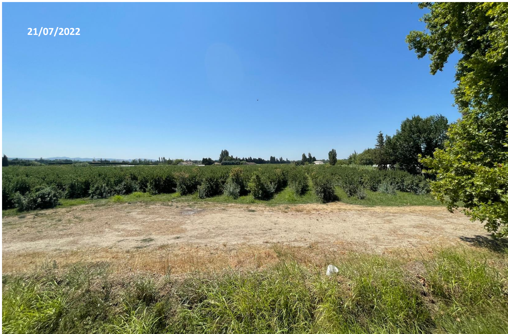
Point de vue n°1 (proche)