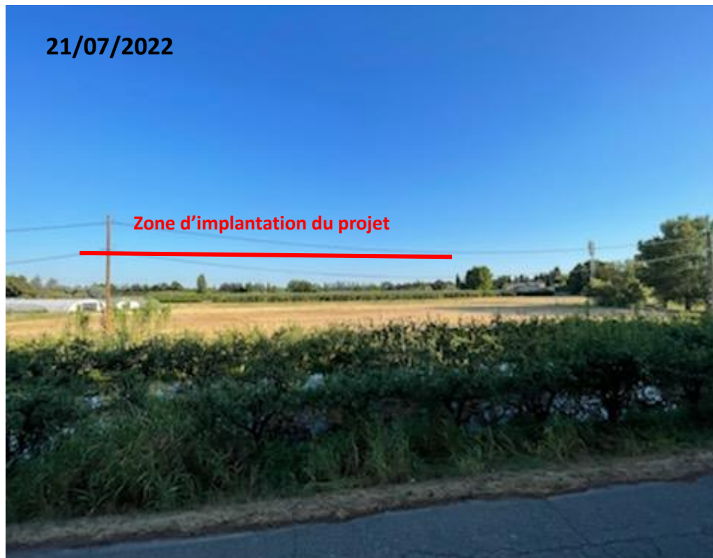
Point de vue n°3 (lointain)