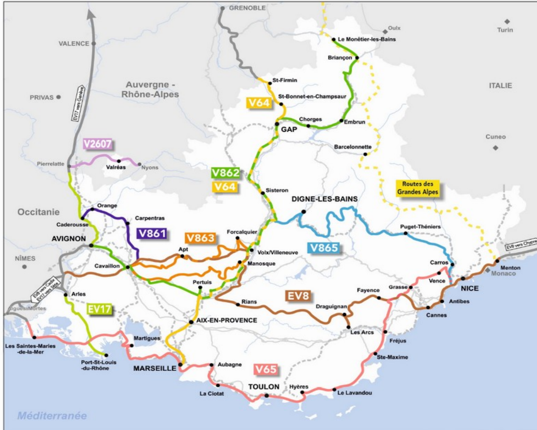
SCHÉMA RÉGIONAL DES VÉLOROUTES ET D'ITINÉRANCE À VÉLO