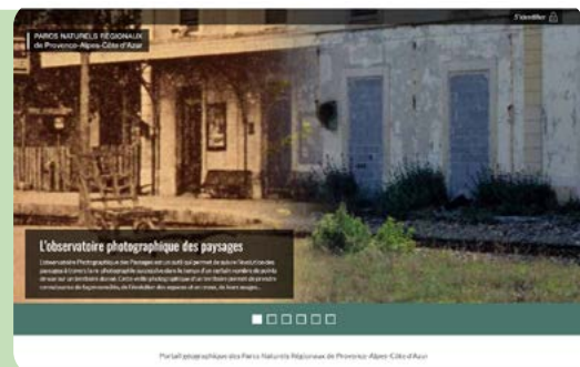
Portail géomatique des Zones Humides Régionales de Provence-Alpes-Côte d'Azur

la DREAL a organisé en 2025 plus d'une trentaine de réunions de concertation avec les acteurs locaux par bassin versant pour l'élaboration du programme de mesures du SDAGE 2028-2032, qui permet de traduire en actions concrètes ce document cadre de préservation de la ressource en eau et des écosystèmes aquatiques. Le SDAGE s'élabore à l'échelle du bassin hydraulique Rhône-Méditerranée et décline la directive cadre sur l'eau de l'Union européenne.