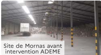
Site de Mornas avant intervention ADEME

Les travaux réalisés ont consisté à évacuer des quantités importantes de déchets en mélange (3010 tonnes pour le site de Mornas et 1750 tonnes pour le site de Valréas) vers des installations de traitement dûment autorisées à les recevoir.