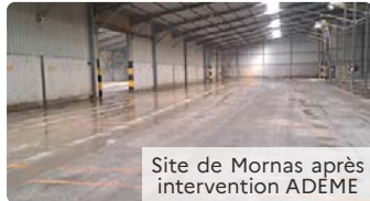
Site de Mornas après intervention ADEME

Inspecter les installations classées pour la protection de l'environnement