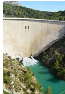
Barrage de Bimont

Les contrôles ont porté sur 60 barrages et 30 systèmes d'endiguement et 10 conduites forcées