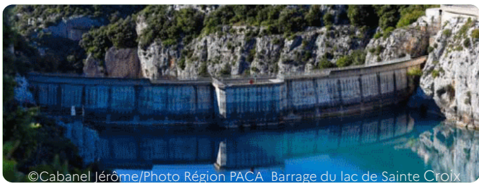
Barrage du lac de Sainte Croix

Démarche des usagers de l'eau pour une bonne gestion de la ressource, se basant sur des études des volumes prélevés, les PTGE identifient de manière concertée des actions visant l'équilibre entre besoins et ressources en eau. Ils respectent la bonne fonctionnalité des écosystèmes aquatiques et anticipent le changement climatique. Il en existe actuellement une dizaine en région qui arrivent à mi-parcours (Haut-Argens pour le Var, Buëch, Drac, Largue, Jabron, Sasse, Lauzon, Vançon pour les Alpes, Coulon Calavon, Ouvèze Provençale pour le Vaucluse), et deux en élaboration (Huveaune et Nartuby), pour lesquels la DREAL apporte son soutien méthodologique.