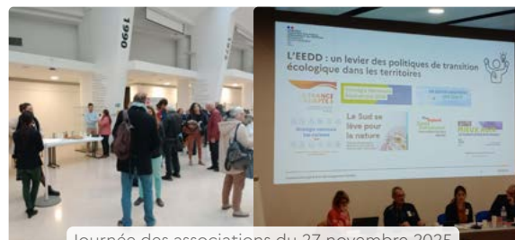
Journée des associations du 27 novembre 2025

https://www.paca.developpement-durable.gouv.fr/journee-des-associations-27-novembre-2025-a16410.html