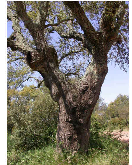
Vieux Chêne liège