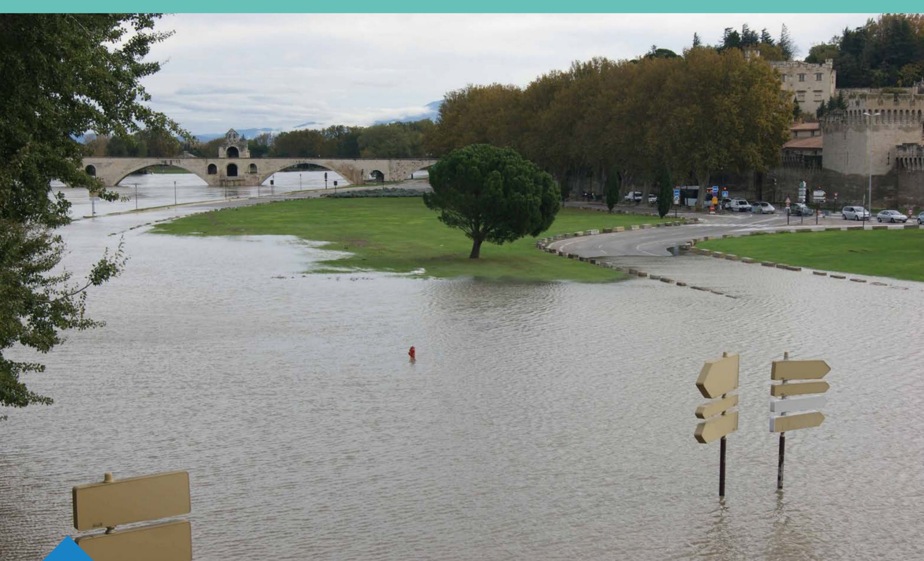
Crue du Rhône sur la commune d'Avignon en 2014