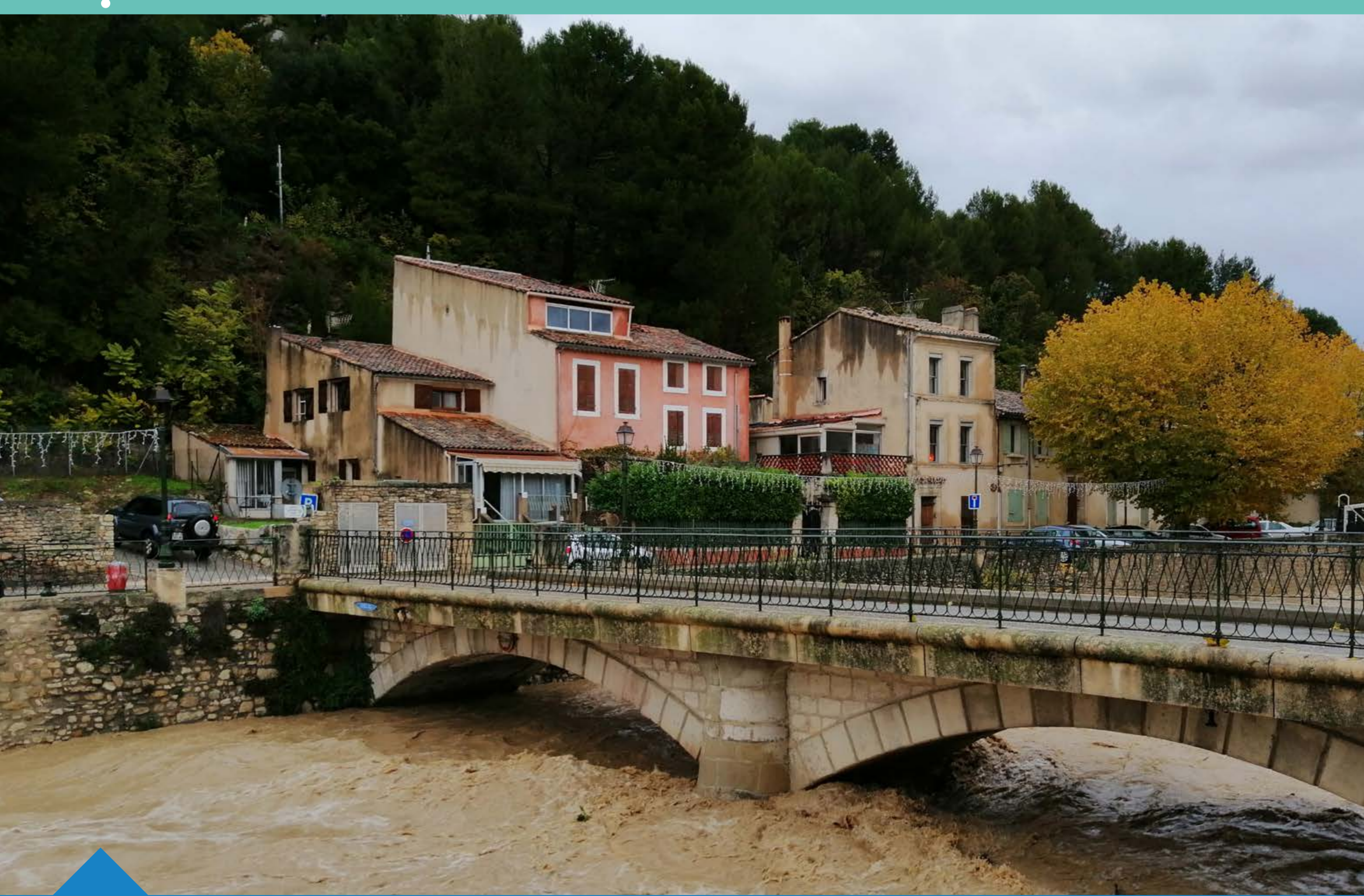
Crue du Calavon à Apt en novembre 2019

Mais aussi ruissellement urbain au niveau des grandes villes : Avignon, Carpentras, Cavillon et Apt