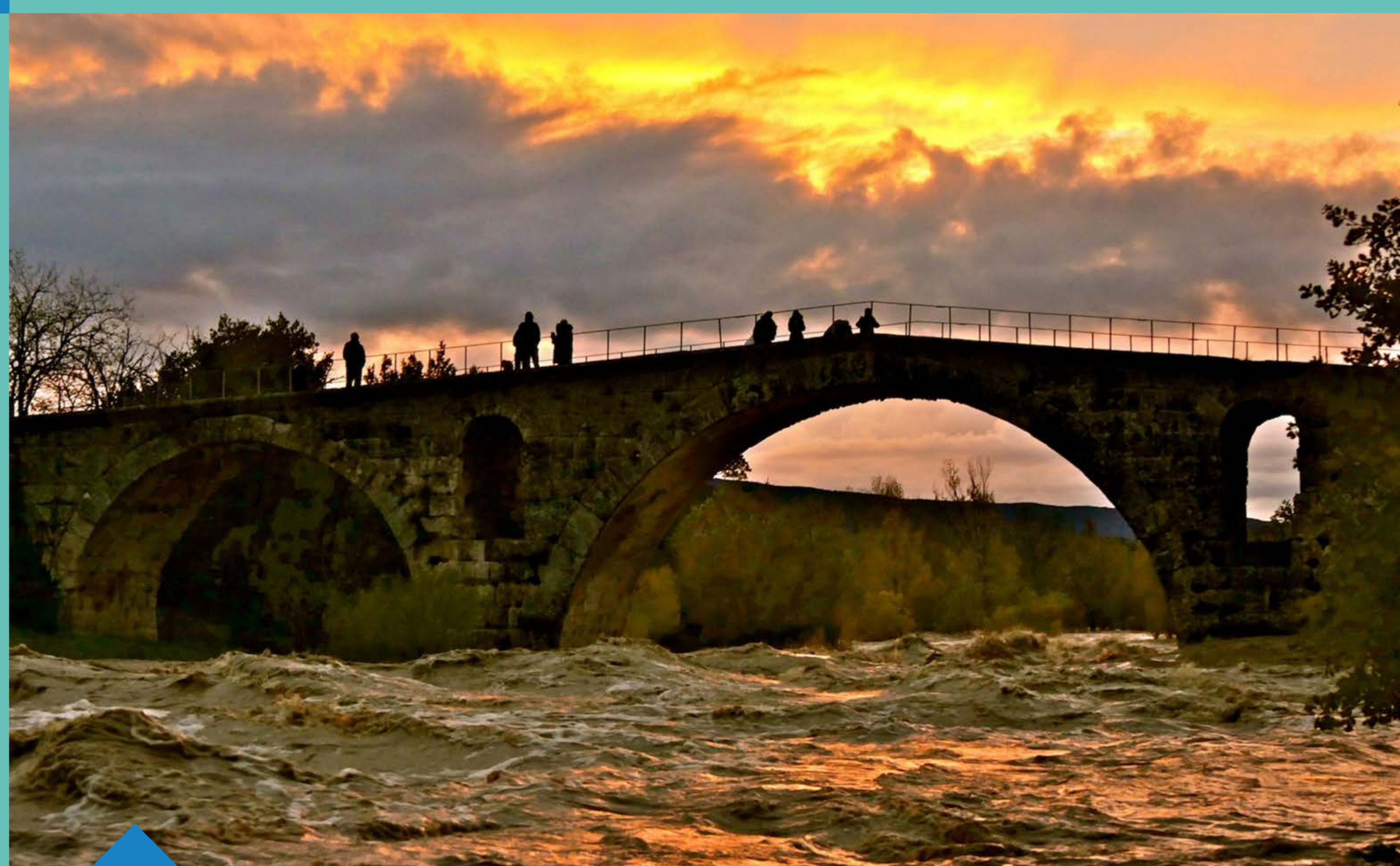
Crue Calavon novembre 2019 – pont JULIEN commune de Bonnieux